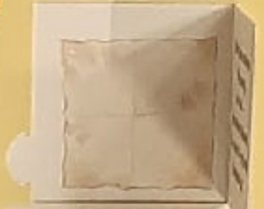
ПОСЛАНИЕ В БУТЫЛКЕ