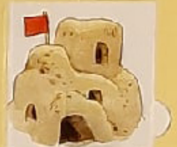
ЗАМОК ИЗ ПЕСКА