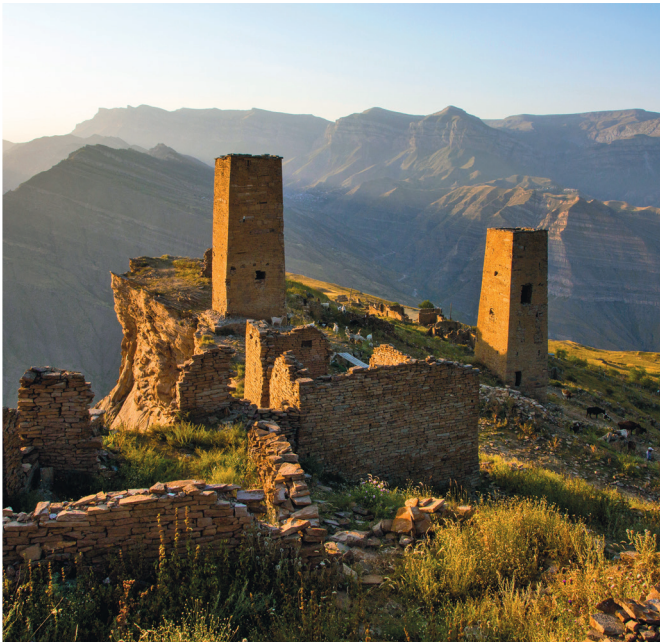
Руины и башни аула Гоор