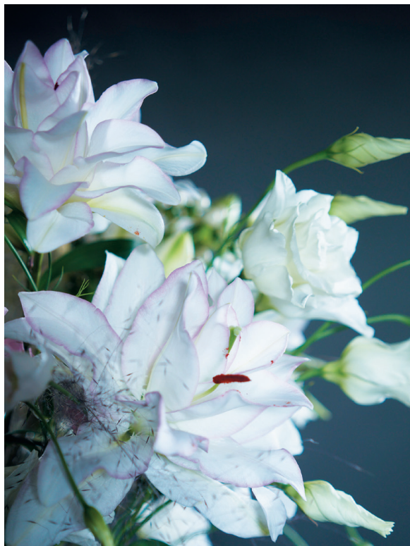
Современная «махровая» лилия. Как видите, тычинок у нее очень мало!

В мои обязанности входило... убирать из цветов тычинки. Дело в том, что пыльца, которая из них высыпается, пачкает одежду, скатерти и лепестки самого цветка, оставляя некрасивые ржавые пятна. И когда я приходил из школы, мама вручала мне пинцет, я шел в подвал и аккуратно выщипывал из раскрывающихся бутонов тычинки. А у лилий их много! Представьте, четыреста лилий и на каждой — шесть-семь бутонов... Даже если учесть, что открываются они не все сразу, времени на обработку одной партии уходило много. Из подвала я выходил примерно с килограммом собранных тычинок! А через несколько дней приходила очередная партия цветов, и все начиналось заново. Видимо, поэтому у меня сохранилось предвзятое отношение к лилиям — я «объелся» ими в детстве. И много лет практически не работал с этими цветами, используя их только в случае крайней необходимости. Но сейчас появились лилии генно-модифицированные — у них очень мало тычинок. Такие цветы