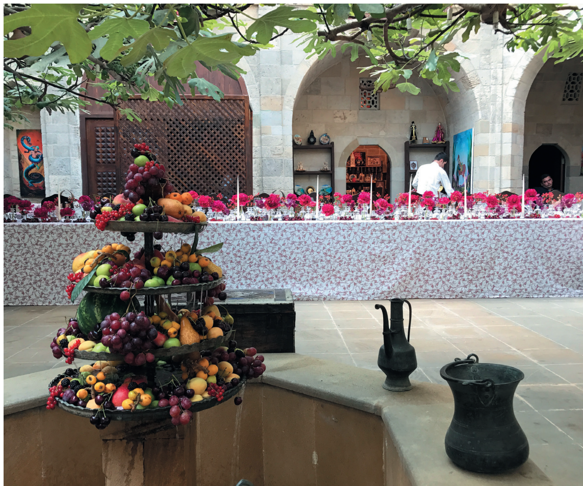
Флористическое оформление должно соответствовать замыслу и традициям мероприятия, в которых его проводят. На снимке — декор в цветах азербайджанского ковра

3. Нужно быть изобретательным! Например, вы должны оформить «цветочную арку» для свадебной церемонии, которая пройдет на открытом воздухе. Погода стоит жаркая. Что сделать, чтобы нежные цветы, украшающие арку, не превратились в вялые тряпочки? Как обеспечить их свежесть и при этом сделать так, чтобы никакие дополнительные приспособления не были видны?