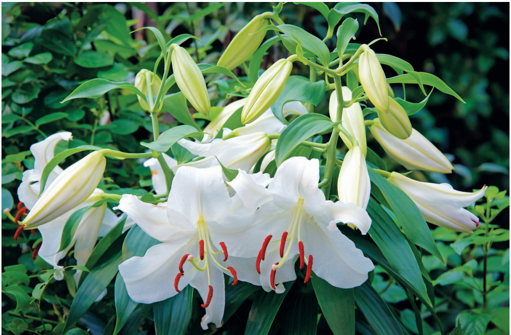
Лилии сорта «Касабланка»

Много лет я старался как можно реже использовать в работе лилии. Все хорошо знают эти красивые ароматные цветы. Чем же они мне не угодили? Возможно, дело в том, что в детстве, когда я был еще школьником и учился в младших классах, мои родители занимались продажей цветов. Жили мы тогда в Кишиневе (Молдавия) в частном доме. В то время очень популярны были лилии, особенно сорта «Касабланка» — красивые, крупные и с невероятно сильным ароматом. И когда приезжала очередная партия лилий, а это триста — четыреста стеблей, родители ставили их в большие чаны (примерно в такие, в каких в школах готовят суп сразу на несколько классов) и размещали в прохладном подвале.