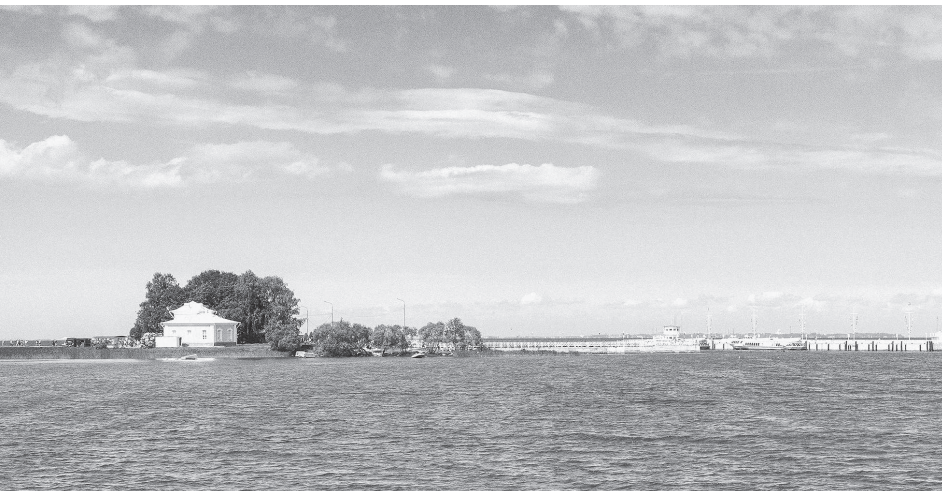
Бухта Финского залива, Петергоф

легенда о безлюдной пустыне на месте будущего Петербурга в народе жила. Скорее всего, ее породили невиданный размах строительства и стремительность появления новой столицы на карте Европы.