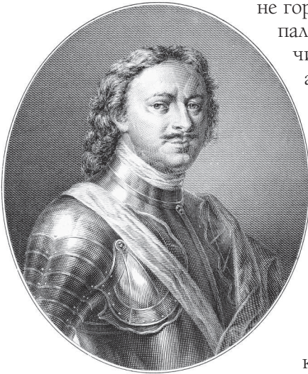
Портрет Петра I Великого. Гравюра, 1912

не гораздо крепко от природы». Выбор пал на удобно расположенный Заячий остров (по-фински Енисари). Даже не укрепленный, остров казался естественной преградой в устье Невы. На нем и была заложена крепость. Под ее защитой на соседнем Березовом острове возник город.