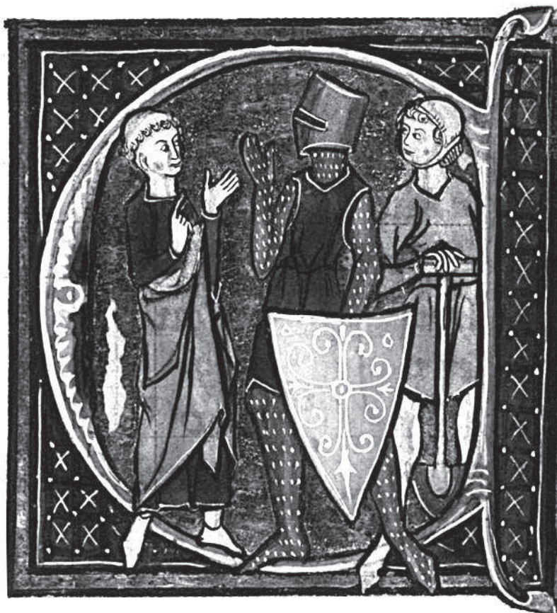
Рыцарь, священник и крестьянин. Миниатюра из фламандского манускрипта конца XIII в.

Еще мальчика обучали, искусству верховой езды, умению точно в цель метать копьё и стрелять из лука, плавать, фехтовать холодным оружием и бороться без оружия. Все эти занятия способствовали быстрому профессиональному росту будущего рыцаря.