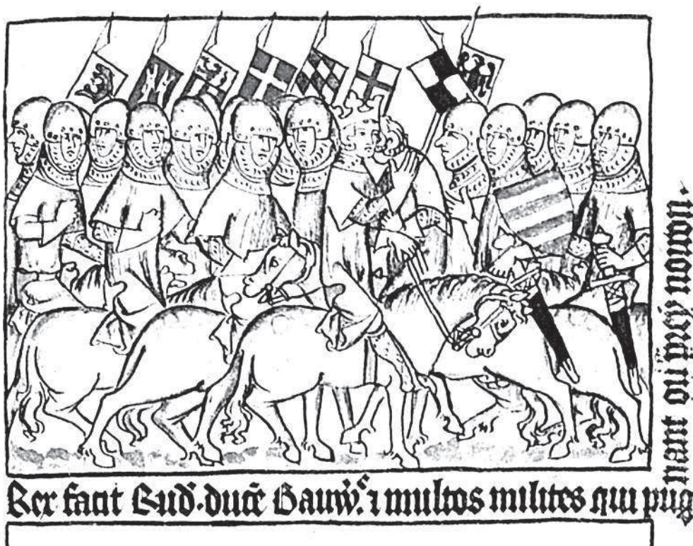
Посвящение в рыцари на Мильвийском мосту. Миниатюра из рукописи XIV в. Текст под рисунком гласит: «Король (Генрих VII) посвящает Рудольфа, герцога Баварии, и многих (других), сражавшихся на лугу Нуарон, в рыцарское сословие»

На Мильвийском мосту 6 мая 1312 г. должно было состояться решающее сражение. По старому обычаю, король перед (ожидаемым) боем посвятил в рыцари нескольких отличившихся дворян, среди которых первое место занимал Рудольф, герцог Баварский (воины отличились в битве при Трипецоне). В случае посвящения в рыцари на поле боя весь обряд посвящения ограничивался тремя ударами мечом по плечу вновь посвящаемого, причем произносились следующие слова: «Во имя Отца, и Сына, и Св. Духа, и св. великомученика Георгия жалую тебя в рыцари». Затем следовало лобзание. На рисунке изображен в окружении воинов король Генрих VII, обнимающий герцога. За ними видны знамена Фридриха Гогенцоллерна и щит владетеля Флекенштайна (они также были здесь посвящены в рыцари). Однако решающей битвы в этот день так и не произошло. Принц Иоанн отвел свои войска в отвоеванные им части Рима.