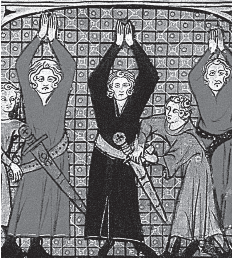
Посвящение в рыцари. Миниатюра XIV в.

Опоясывание мечом являлось важным ритуалом посвящения в рыцари. Меч (нем. Schwert ; англ. Sword ; франц. Épée ; испан. Espada ; итал. Spada ) — вид холодного оружия с прямым обоюдоострым клинком (нем. Klinge ; англ. Blade ), остrokонечным или закругленным у острия, длиной более 60 см, весом не менее 600 г, предназначенного в основном для рубящего удара, но не исключает и колющие. Обычный вес одноручного меча с клинком около 80 см и черенком рукояти 12 см составляет 1100 г. При этом ширина клинка у пятки 4–7 см, сужается до 2–4 см, толщина клинка у пятки примерно 0,5 см, у острия 0,25 см. Для удобства в применении и некоторой защиты кисти руки рукоять меча снабжена гардой. Клинок меча снабжен углублениями-долами для облегчения. Меч принято носить в ножнах, сделанных из дерева, покрытых кожей или дорогой тканью, украшенных и укрепленных металлическими накладками. Ножны крепились в большинстве случаев перевязью к поясу.