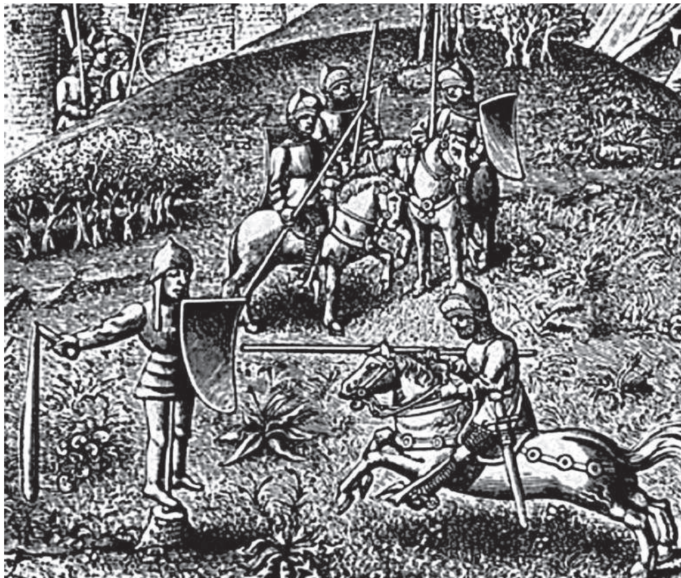
Тренажер для отработки копейного удара. Рисунок XV в.

Самым простым тренировочным снарядом являлся вбитый в землю столб, на котором закрепляли щит или доспех, а иногда и просто надевали деревянную бочку, все это сооружение служило в качестве противника. От конного воина требовалось нанести точный и мощный удар копьем, так, чтобы столб свалился на землю. Для придания реализма поединка вместо простого столба устанавливали специальный манекен, изображающий вооруженного воина (чаще всего сарацина). Тренирующийся, нанося удар копьем, целился в точку между глаз этой фигуры. Более сложный тренировочный тренажер представлял собой вкопанный в землю шест, на котором размещалась свободно вращающаяся фигура воина в полном вооружении. Фигуру, помещенную на оси, располагали так, чтобы удар копьем, пришедшийся не в центр, а сбоку, заставлял ее вращаться с большой скоростью, при этом оружие фигуры наносило тренирующемуся ощутимый удар. Чаще всего оружием фигуры служил простой мешок с песком, который при вращении мог выбить из седла неловкого всадника.