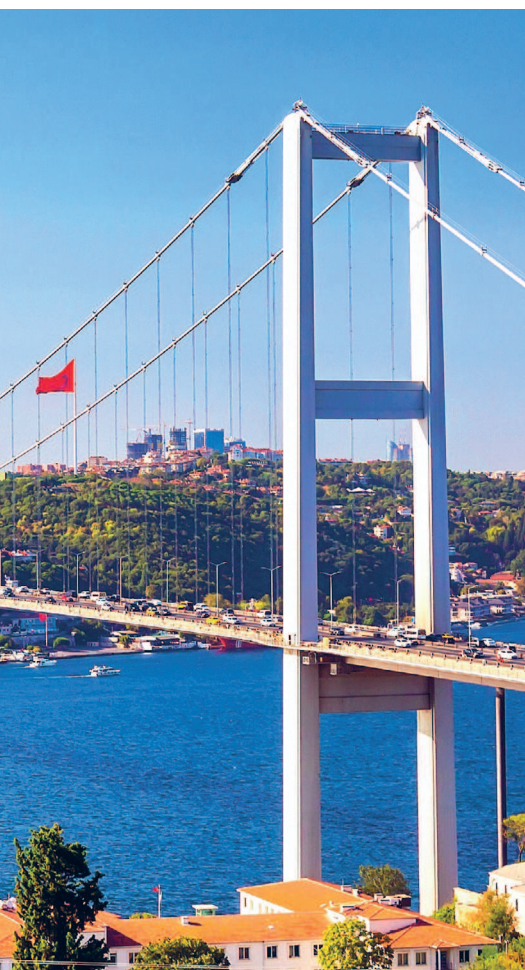
Стамбульский Босфорский мост

Географически располагаясь в двух частях света и имея холмистую местность, Стамбул находится в зоне действия субтропического и средиземноморского климата. С севера на погоду существенное влияние оказывают холодные воздушные массы. Наиболее благоприятные месяцы для прогулок по городу — апрель–июнь и сентябрь, но и в другое время Стамбул весьма гостеприимен. Снег зимой бывает очень редко, поэтому если вам доведется увидеть город под белоснежным покрывалом, можете смело загадывать желание и наслаждаться невероятно красивым зрелищем. Самое красочное весеннее мероприятие — это Тюльпановый фестиваль. Осень продлевает летнее тепло на весь сентябрь, а иногда дарит чудесные дни и до конца октября. Какое бы время года вы ни выбрали, будьте уверены, надежным спутником и увлекательным рассказчиком в вашей поездке станет этот путеводитель.