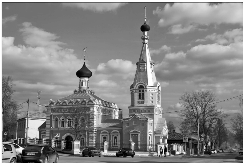
Старообрядческий храм Семенова

Когда я рассказывала в своих книгах об итальянской кухне, я часто упоминала поваров-аристократов при папском и княжеских дворах, написавших первые кулинарные книги во времена Средневековья, о рецептах, записанных Плинием Старшим в Древнем Риме. И если документы описывали блюда на банкете эпохи Ренессанса, то можно быть уверенным, что лет за пятьдесят до этого банкета рецепты с пометками повара уже появились в какой-нибудь кулинарной книге «Мазстро из Комо».