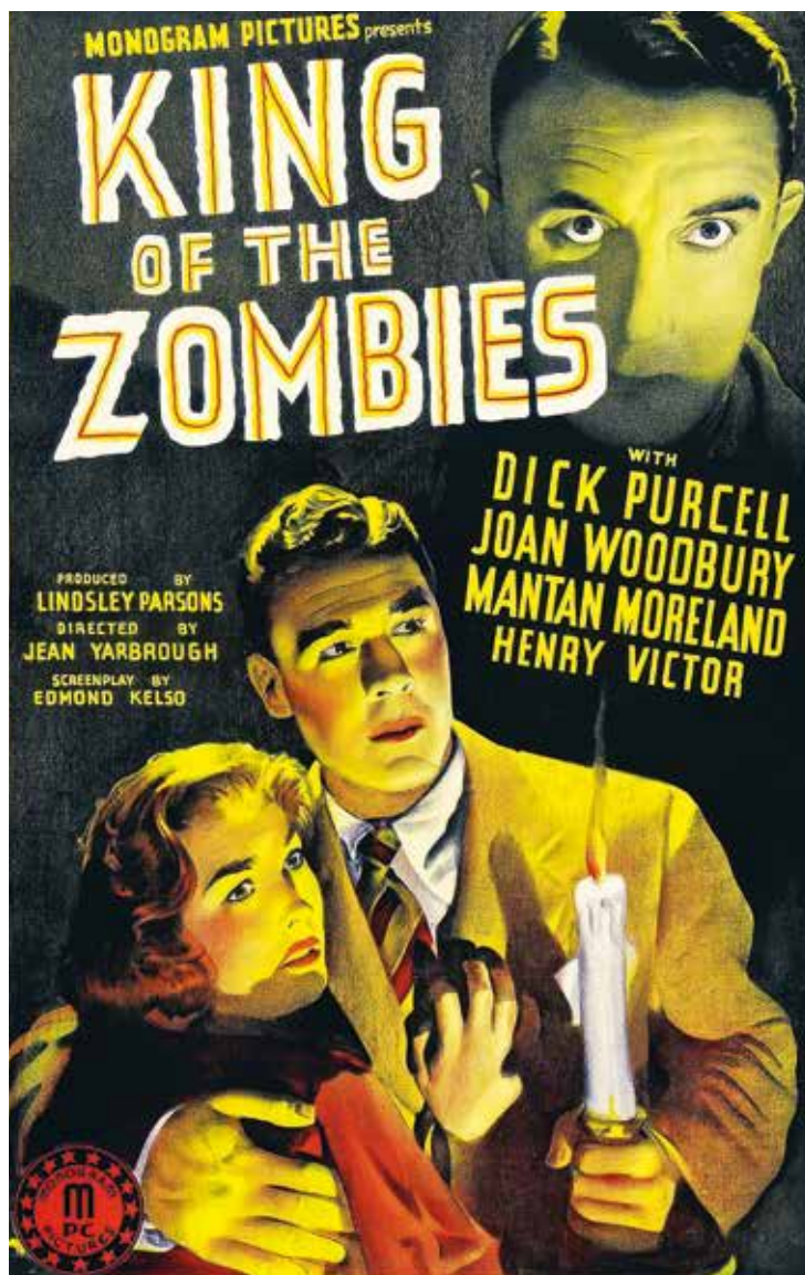
Постер к фильму «Король зомби», реж. Жан Ярбро, Sterling Productions, Inc., 1941 год