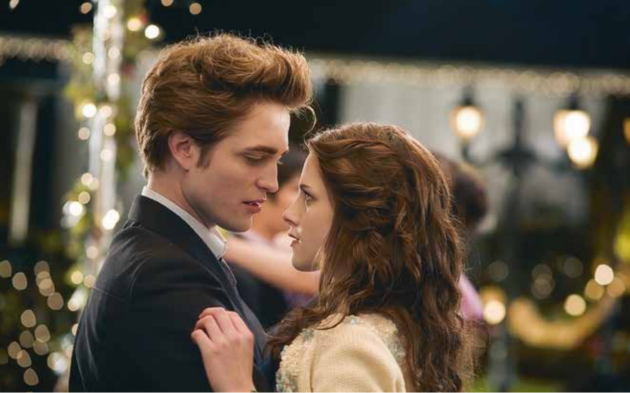
Роберт Паттинсон и Кристен Стюарт в фильме «Сумерки», реж. Кэтрин Хардвик, Summit Entertainment, 2008 год

Другая же линия фильмов, рассказывающая о вампирах как о главных героях любовных романов, лучше всего может быть представлена сериалом «Дневники вампиров» (1991–2011) и, конечно, сагой «Сумерки». Картины были коммерчески успешны, потому что создатели четко слышали желания своей целевой аудитории, желающей увидеть притягательных вампиров, но без сопутствующих этому жанру проблем. Экранизация романов Стефани Майер состоит из пяти фильмов, которые выходили в период с 2008 по 2012 год. Они рассказывают историю любви между обычной девушкой Беллой и вампиром Эдвардом Калленом. Важнейшее изменение, которое возникло благодаря саге, – это то, что мы теперь не просто не боимся образа «Чужого», мы влюбляемся в него, принимаем и живем с ним дальше без каких-либо преград.