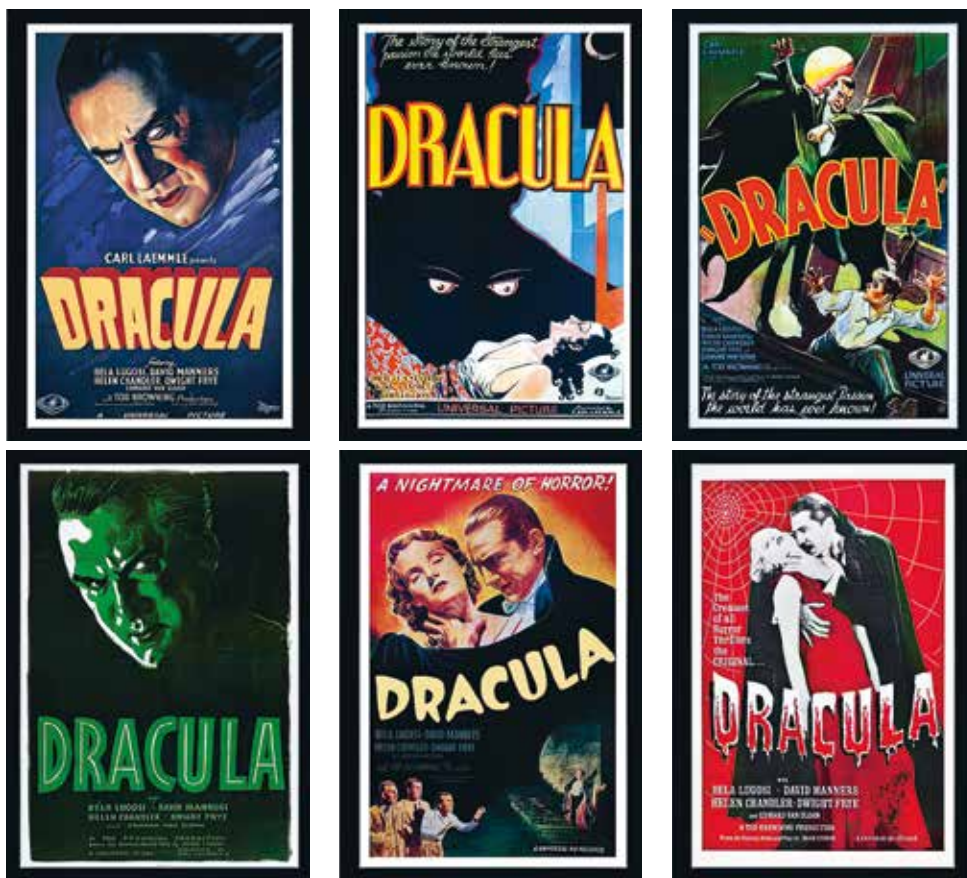
Постеры к фильму «Дракула», реж. Тод Браунинг и Карл Фройнд, Universal, 1931 год

Джордж Байрон, Перси и Мэри Шелли, а также сам Полидори, приехав на отдых в Швейцарию и столкнувшись с ужасной погодой, решили не выходить на улицу, а устроить конкурс «страшных рассказов». Мэри Шелли написала работу «Франкенштейн, или Современный Прометей», а набросок, придуманный Байроном, три года спустя завершил Полидори и издал под названием «Вампир». Примечательно, что первые издания выходили под авторством Байрона, в то время как тот ничего не подозревал. Повесть обрела большую популярность отчасти