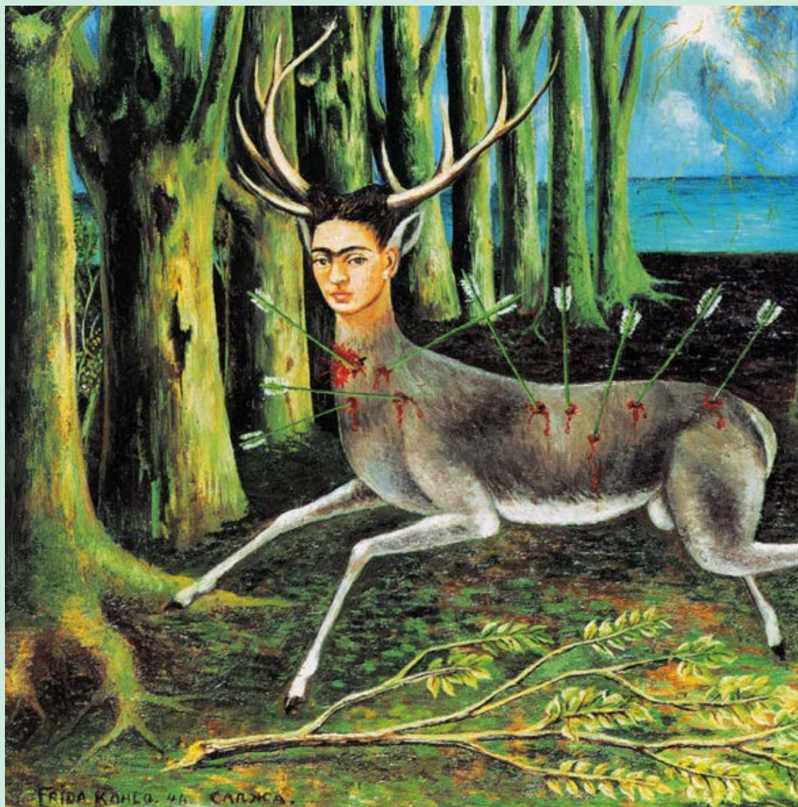
Фрида Кало. Раненый олень (маленький олень). 1946. Частная коллекция, Чикаго.