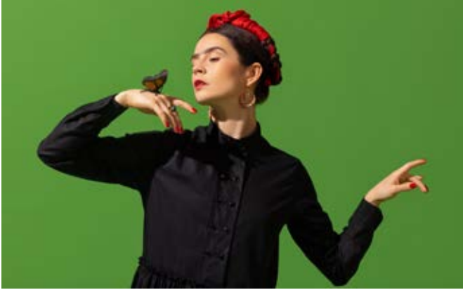
Модель в образе Фриды Кало

этой стране и ее искусстве. Красивая женщина с изломанным телом, постоянно испытывающая боль.