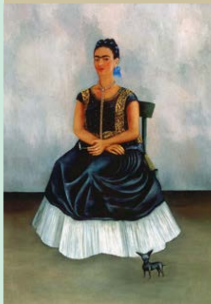
Фрида Кало. Автопортрет с собачонкой. 1938. Частная коллекция

Фрида Кало. Автопортрет с обезьянкой. 1940. Частная коллекция