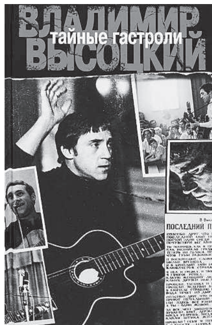
Обложка моей первой книги

Журналистское расследование обстоятельств гибели Виктора Цоя стало второй в моей творческой биографии темой, которая серьезно и глубоко увлекла меня. В первый раз это случилось в 1986 году — тогда я начал собирать воспоминания людей, принимавших участие в ленинградской биографии моего любимого Владимира Высоцкого. Сбор информации длился до начала 90-х, а потом наступил двадцатилетний перерыв, в течение которого я стал журналистом и понял, как можно написать об этом интересную книгу. Она вышла в 2012 году, называлась «Тайные гастроли. Ленинградская биография Владимира Высоцкого», и, кстати, все четыре тиража были благополучно распроданы.