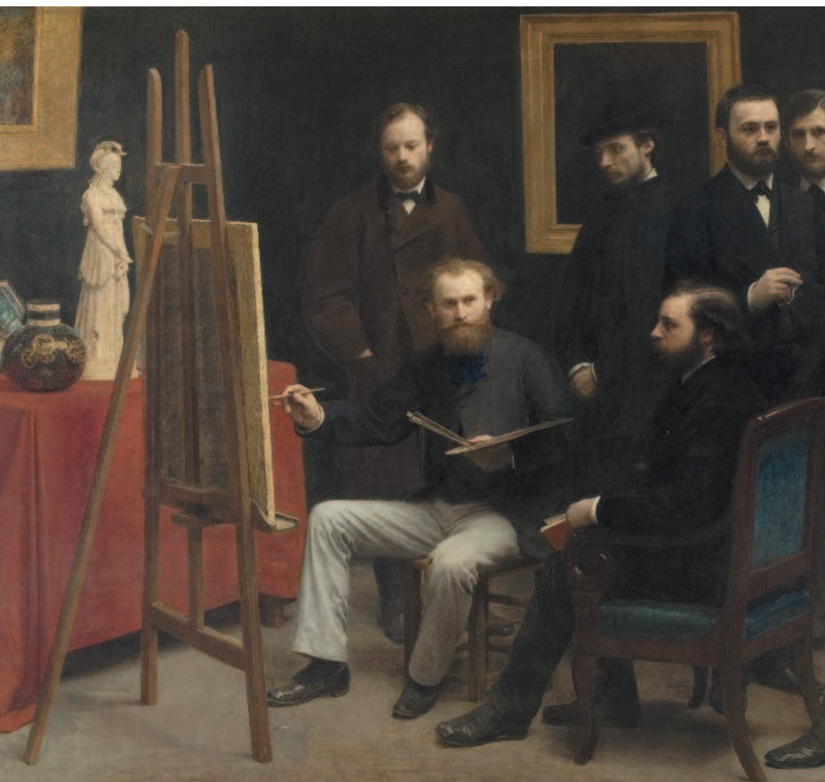
Анри Фантен-Латур. Мастерская в квартале Батиньоль (1870, фрагмент). Музей д'Орсе, Париж