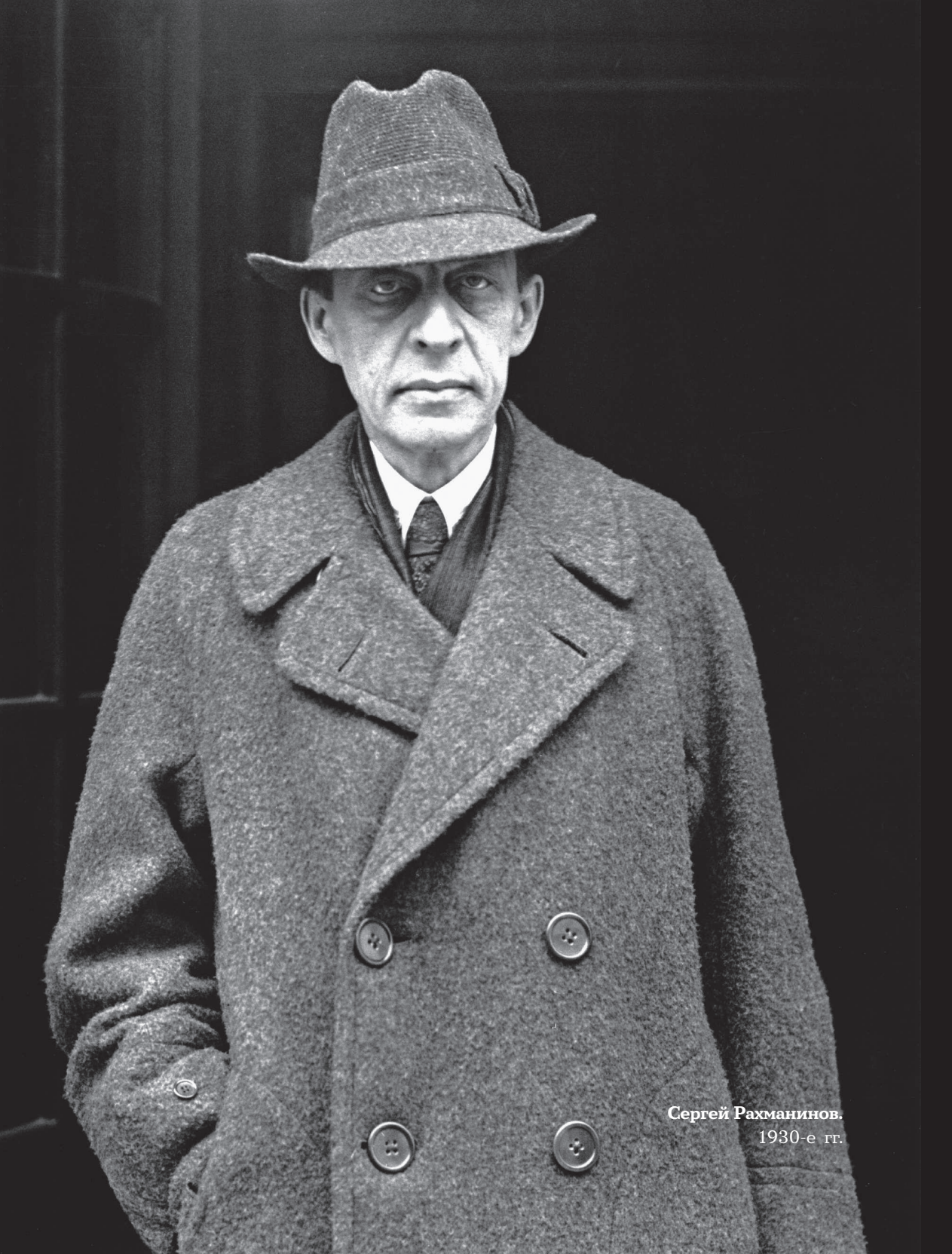
Сергей Рахманинов. 1930-е гг.