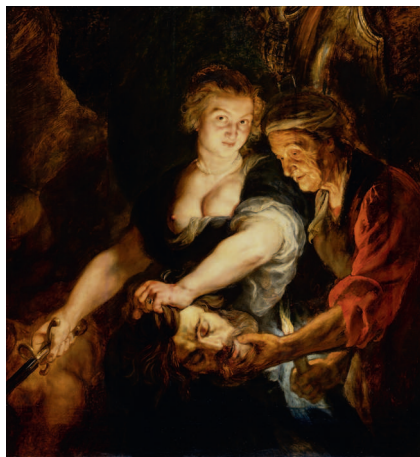
Питер Пауль Рубенс. Юдифь с головой Олоферна. Ок 1617. Музей герцога Антона Ульриха, Брауншвейг

Первая половина повествования посвящена войне, амбициям захватчиков и могучей силе ассирийцев, жаждавших добиться покорности несогласных. Для похода на Ветилую Навуходосор выбрал Олоферна, который славился успешными завоеваниями территорий и народов. Он должен был разрушить все священные места израильтян и заставить их признать нового бога в лице Навуходоносора. Для этого многочисленная армия ассирийцев и осадила не желавшую покоряться Ветилую, «ворота Иерусалима».