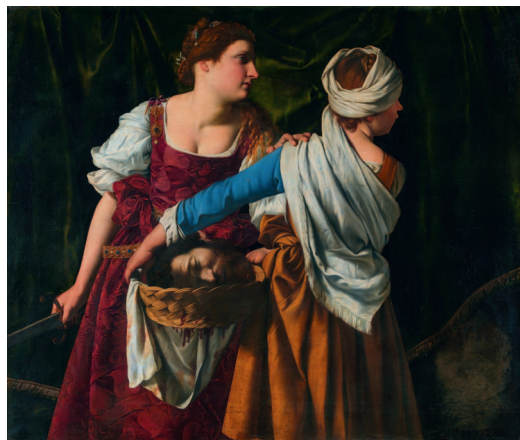
Орацио Джентилески. Юдифь и её служанка с головой Олоферна. 1608. Новый Национальный музей в Вике, Осло

...омыла тело водою и намастилась драгоценным миром, причесала волосы и надела на голову повязку, оделась в одежды веселия своего, в которые она наряжалась во дни жизни мужа своего Манассии; обула ноги свои в сандалии и возложила на себя цепочки, запястья, кольца, серьги и все свои наряды,