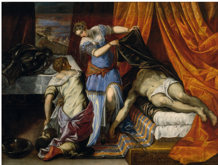
Якопо Тинторетто (мастерская). Юдифь и Олоферн. Ок. 1577. Прадо, Мадрид

семью Джентилески. Во-первых, Тасси обвинил их семейство в разврате, заявив, что якобы Орацио сам состоял со своей дочерью в кровосмесительной связи, а их дом был ни много ни мало борделем. По словам Тасси, отец продавал Артемисию разным мужчинам — заметим, за буханку хлеба, что, конечно, не вяжется с тем фактом, что Орацио был востребованным римским художником. Не менее лживо звучит и обвинение в том, что Артемисия состояла в эротической переписке со множеством мужчин. Это совершенно не вяжется с тем обстоятельством, что на тот момент художница умела писать только маслом по холсту — графоте она обучилась сильно позже.