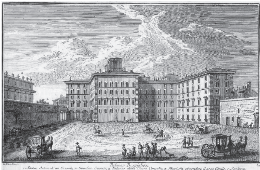
Джузеппе Вази. Палаццо Роспильози в Риме. 1754 С росписей этого дворца началось активное общение Орацио и Агостино

что большие пальцы рук обматывали верёвками и скручивали так, что к ним переставала поступать кровь, а боль была невыносима. К моменту, о котором идёт речь, Артемисия уже являлась самостоятельной художницей, и повреждение пальцев могло крайне плачевно сказаться не только на её здоровье, но и карьере. Несмотря на возможный ущерб, Артемисия не отказалась от своих показаний и повторяла «è vero, è vero, è vero» («это правда, это правда, это правда»).