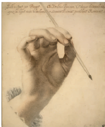
Пьер Дюмустье. Правая рука А. Джентилески. 1625. Британский музей, Лондон

Этот «детектор лжи» XVII века был применён не к насильнику, а к его пятнадцатилетней жертве. Изобретённая инквизицией «Сибилла» широко применялась в Италии по отношению к женщинам, пытавшимся доказать факт пережитого сексуального насилия. Считалось, что под пытками они могли признаться в лжесвидетельстве — во что охотнее верилось судьям. Суть пытки заключалась в том,