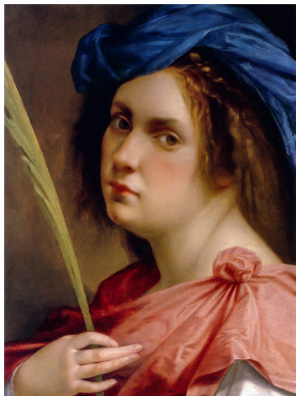
Артемисия Джентилески. Автопортрет в образе мученицы. 1615. Частная коллекция, Нью-Йорк

В 1612 году во время судебного разбирательства по делу художника Агостино Тасси, обвинявшегося в лишении им девственности дочери известного римского живописца Орацио Джентилески Артемисии, использовалось пыточное орудие типа «Сибилла».