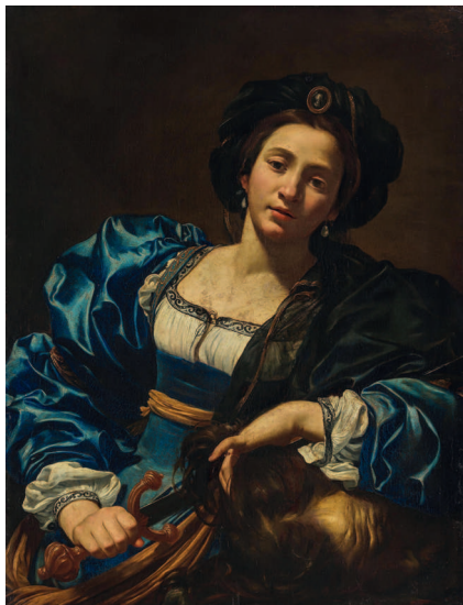
Симон Вуэ (или последователь). Юдифь с головой Олоферна. 1-я пол. XVII в. Старая пинакотeka, Мюнхен

Жителям города перекрыли доступ к воде, и, страдающие от жажды, они стали возмущаться и упрекать правителей в том, что те не сдались сразу — ведь им казалось, что ассирийцы вскоре всё равно победят.