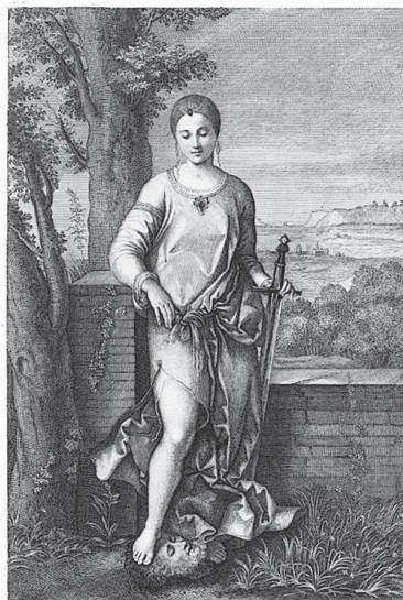
JUDITH S'après le Tableau de Raphaël qui est dans le Cabinet de M r Crozat. haut de 4 pieds 4 lignes de 3 pieds 6 lignes peint par le maître l'année 1513.

Туанетта Ларшер по мотивам картины Джорджоне «Юдифь». XVIII в. Библиотека Национальной художественной галереи, Вашингтон