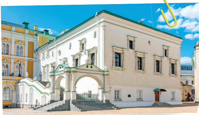
Грановитая палата Кремля

Однако вскоре царь Иван IV Грозный заболел. Наша девочка ухаживала за своим венценосным свекром до самой его смерти. На престол взошел ее супруг — Федор I. Произошло это в 1584 году. Во время церемонии венчания на царство для Ирины был поставлен отдельный трон, чего раньше не было. Обычно государи скрывали своих жен от народа. Федор же очень любил молодую супругу не только за красоту, но также ценил ее ум и рассудительность. Хотел, чтобы все видели, какая достойная у него жена. После этого даже возникла традиция приема гостей нашей девочкой в Золотой Царицыной палате.