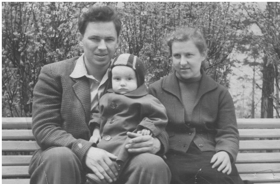
Володя Шахрин с родителями, 1960