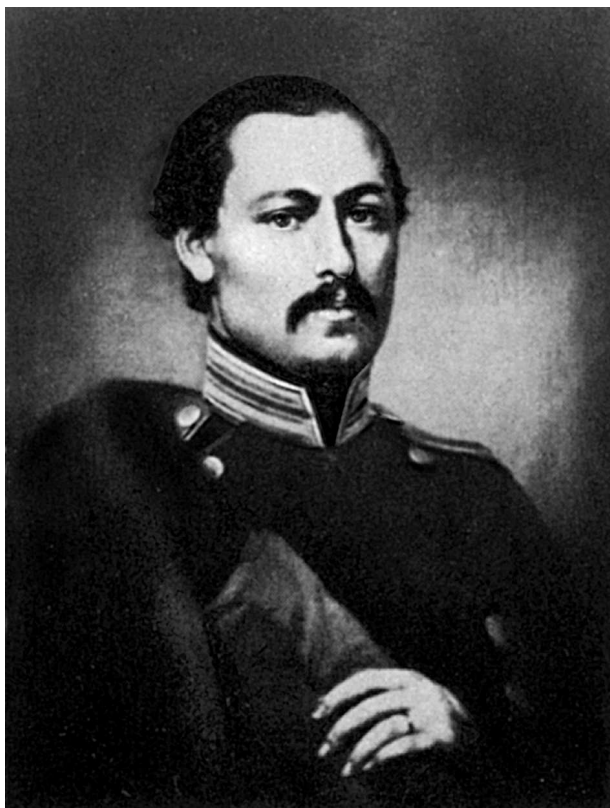
А. А. Фет. Портрет работы неизвестного художника. 1840-е гг.