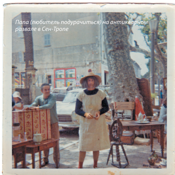
Папа (любитель подурочиться) на антикварном развале в Сен-Тропе

Возможно, когда вы увидите, насколько легки в исполнении некоторые техники, вам и самим захочется их опробовать! Да, сейчас они кажутся непонятными или доступными только профессионалам, но на самом деле для них не требуется ни дорогих и мощных инструментов, ни навыков промышленного химика. В основе классических методов реставрации и отделки лежат три средства — масло, воск и спирт — и ручная работа. А еще для них не требуется отдельной студии или мастерской: достаточно подстелить под мебель тряпку на вашей кухне.