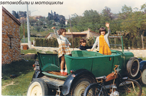
1 Мы с сестрами. На нашей «игровой площадке» были старые автомобили и мотоциклы

К сожалению, эти техники, которые составляют основу моего ремесла, утрачиваются в эпоху, когда предпочтение отдается лакам в виде спрея для нанесения в один слой. Что случилось с традиционными приемами отделки дерева, с техниками моего отца, бабушки и других искусных мастеров? То, что прежде было знакомо многим, теперь доступно лишь нескольким пожилым специалистам, в мастерских которых стоят флаконы с названиями, по экзотичности сравнимыми с персидскими духами. Бывает, что даже опытным столярам не знаком секрет создания идеального воскового покрытия — если только в их библиотеке нет запылившихся руководств на французском языке конца XIX века. Лишь немногие знания старого мира были перенесены за океан,