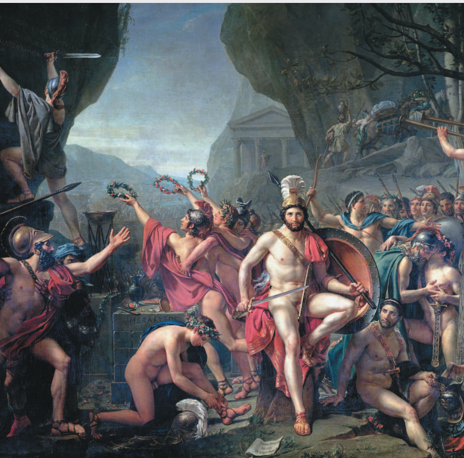
Жак-Луи Давид. Леонид при Фермопилах (фрагмент).

не заставили персов отказаться от планов покорения Греции. Сын Дария I — Ксеркс I — решил довершить начатое отцом и собрал огромную армию из множества народов громадной империи. Кроме сухопутного войска у Ксеркса I был мощный флот, снаряженный прибрежными и островными народами, входившими в его государство.