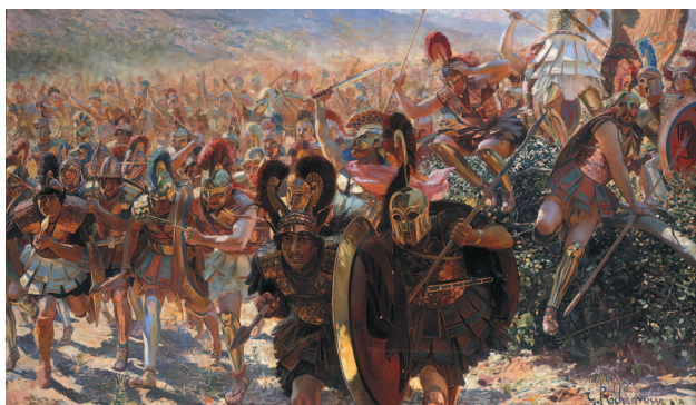
ЖОРЖ АНТУАН РОШГРОСС. ГЕРОИ МАРАФОНА.