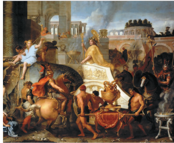
Шарль Лебрэн. Вступление Александра в Вавилон (фрагмент).

После битвы при Гавгамелах завоевателям сдались Вавилон и другие города Персидской империи, а персидские вельможи принесли присягу на верность Александру — новому повелителю Азии.