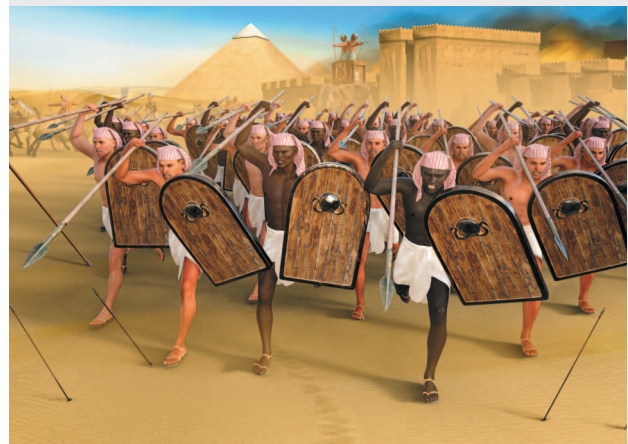
Воины Древнего Египта (фрагмент).