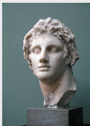
Бюст Александра Македонского из коллекции глиптотеки Карлсберга.