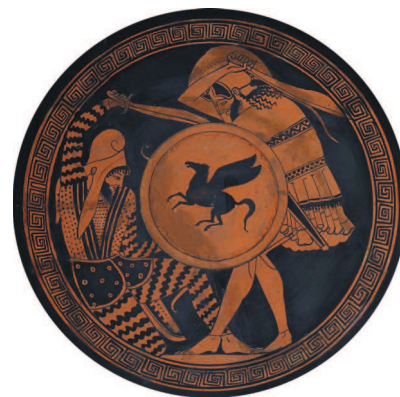
Греческий гоплит и персидский воин сражаются друг с другом. Изображение на древнегреческом сосуде.