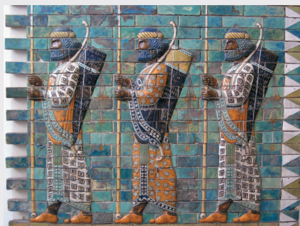
Персидские воины. Фриз из коллекции Пергамского музея, Берлин.

Афиняне захватили семь персидских кораблей, но большинство смогли уйти в море. Персы попытались обойти мыс Сунион и атаковать Афины с моря, но планы врагов были вовремя разгаданы Мильтиадом. Греческая армия совершила форсированный марш к Афинам и смогла опередить персов. Увидев перед собой готовых к бою афинян, персы отказались от планов вторжения и вернулись в Азию.