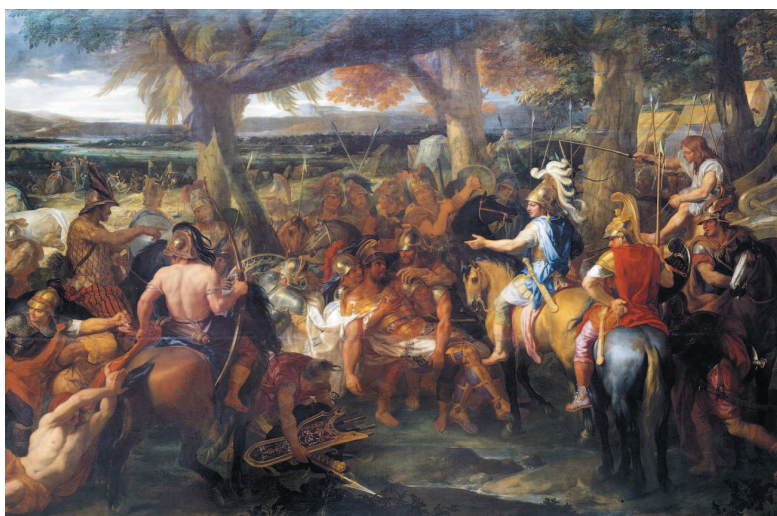
Шарль Лебрен. Александр и Пор (фрагмент).