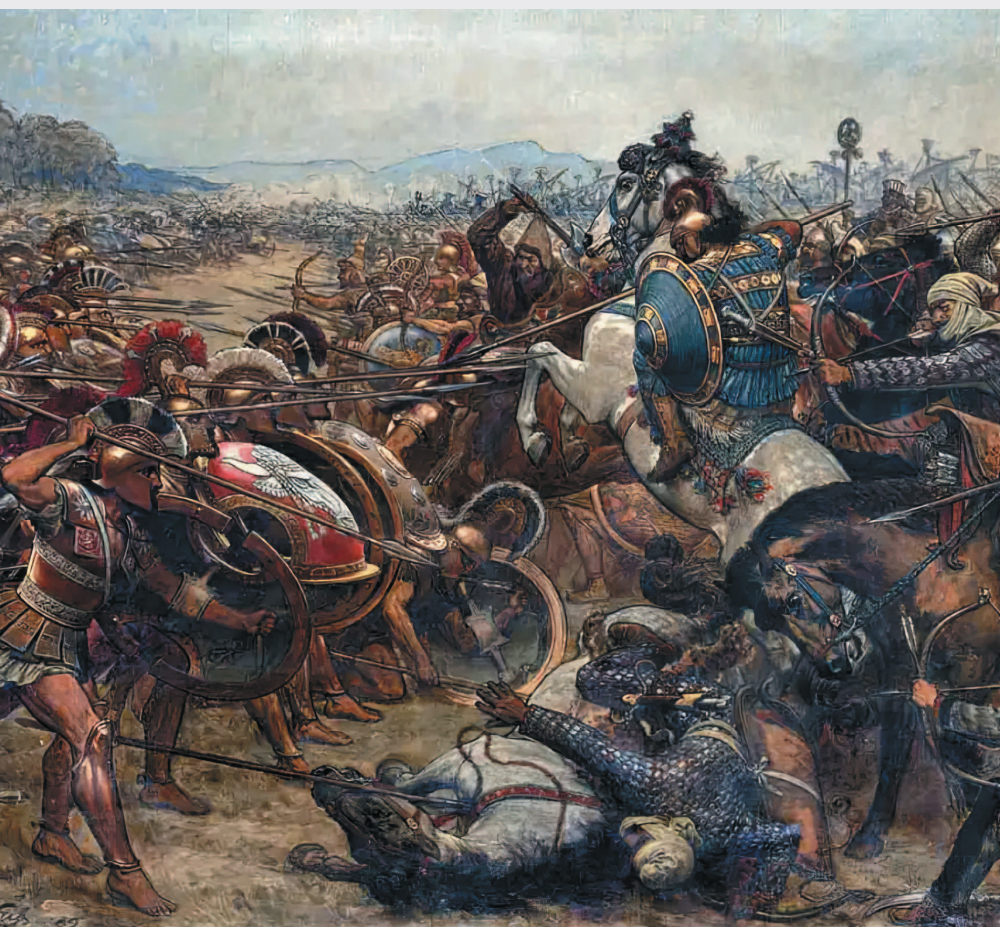
Герман Кнакфус. Битва при Марафоне (фрагмент).

и находившиеся под властью персидского царя Дария I, подняли восстание, которое получило название Ионического. Представители повстанцев отправились к родственным им грекам западного побережья Эгейского моря, но на их призыв о помощи откликнулись лишь полисы Эретрия и Афины. Повстанцам совместно с афинянами удалось захватить и сжечь столицу сатрапии город Сарды, но в конце концов восстание было подавлено. Дарий I желал мести.