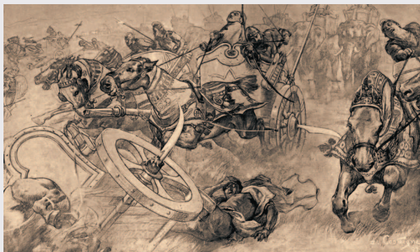
Андре Кастен. АТАКА ПЕРСИДСКИХ СЕРПОНОСНЫХ КОЛЕСНИЦ.

Битва при Гавгамелах стала решающим сражением между армиями Александра Македонского и персидского царя Дария III, после которого могучая и имевшая более чем двухвековую историю империя Ахеменидов прекратила свое существование.