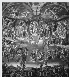
Фреск «Стр шный суд» Микел нджело Буон рроти в Сикстинской к пелле (1536–1541)

Предст вления христи н о Судном дне р знятся: кто-то считает, что души умерших ждут его, чтобы предст ть перед Созд телем и отпр виться в р й или д, в то время к к другие верят, что души поп д ют н Божий