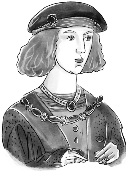
Рис. 1. Юный Генрих VIII

Екатерина была обручена с Артуром столько, сколько себя помнила, а теперь осталась вдовой в чужой стране на непонятных условиях, причем вдовой неслучившегося короля.