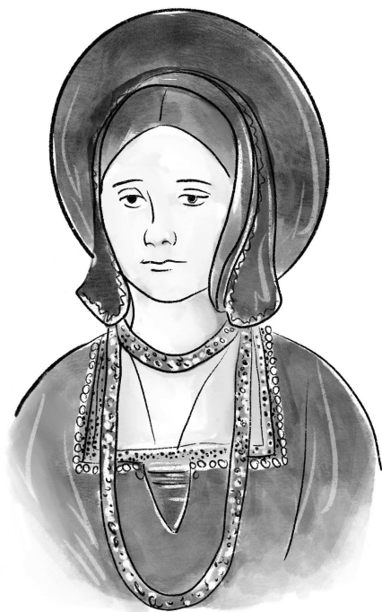
Рис. 2. Екатерина Арагонская

Юный Генрих обещал быть просвещенным королем. Ему дали разностороннее образование. Он знал семь языков: английский, французский, испанский, немецкий, итальянский, латынь и греческий. А еще он изучал семь свободных искусств: грамматику, риторику, диалектику, арифметику, геометрию, музыку и астрономию. Интересовался исто-