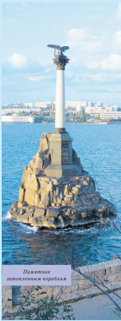
Памятник затопленным кораблям

С самого начала город делился на три части: Центральную часть, Корабельную сторону и Северную сторону. На Корабельной и Северной селился простой люд, отставные матросы с семьями, а центральная считалась аристократической. Но и здесь, сразу за домами почтенных граждан, начиналась безобразная