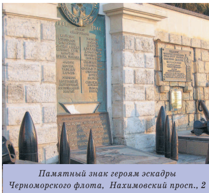
Памятный знак героям эскадры Черноморского флота, Нахимовский просп., 2

За памятником просматривается ажурная колоннада 6 Графской пристани. Пер-