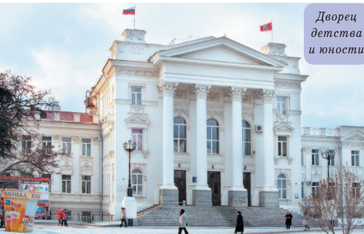
Дворец детства и юности

На противоположной, Северной, стороне видны две монументальные массивные постройки – Михайловский (прямоугольный) и Константиновский (полукруглый) форты – береговые укрепления, возведенные накануне Крымской войны в 1846 и 1847 гг. Изначально фортов было 5 на разных мысах вокруг Севастопольской бухты. Один из них – Николаевский – находился как раз на месте Приморского бульвара. До наших дней сохранились только два. Их мощные стены выдержали артобстрелы Крымской и Великой Отечественной войн. Сейчас Константиновский находится на территории военной части, а Михайловский является музеем и открыт для посещения.