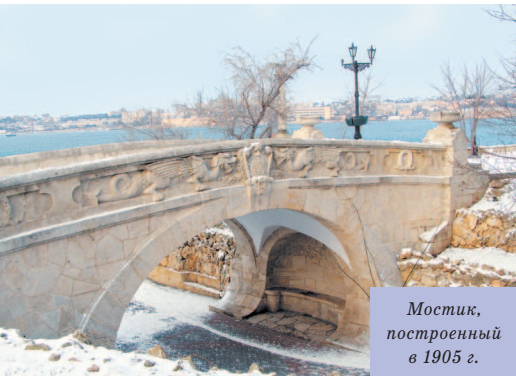
Мостик, построенный в 1905 г.

вая пристань в Севастополе была построена почти сразу после основания города (1783 г.) по указанию командующего Черноморской эскадрой графа Войновича. И, хотя официально она называлась Екатерининской, народ упорно именовал ее Графской. Граф, видимо, был личностью неприязнительной, и обычный деревянный причал, без всяких архитектурных изысков, его устраивал. Знаменитая колоннада появилась только в 1846 г. В те годы военным губернатором Севастополя был адмирал Лазарев. Он и решил облагородить неказистую пристань. Проект был заказан военному инженеру Д. Уptonу. В те времена любой архитектурный проект должен был предоставляться для утверждения на высочайшее имя. Сложно сказать, чем Николаю I не понравилась колоннада. Проект был утвержден без нее. Каких только аргументов не приводил военный губернатор, чтобы убедить монарха в целесообразности постройки.