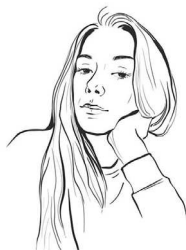
Иллюстрация на обложке и художественное оформление Анастасии Зининой

УДК 821.161.1-93 ББК 84(2Рос+Рус)-6 Ч-77