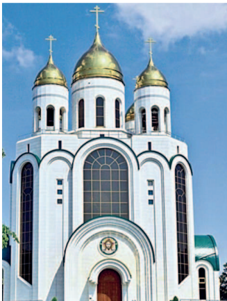
Храм Христа Спасителя