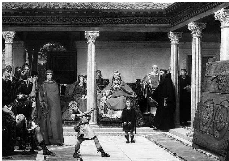
Лоуренс Альма-Тадема. Воспитание детей Хлодвига. XIX в.

дехильда проявила истинно христианское смирение, сказав: «Благодарю своего Господа за то, что он призвал это маленькое существо в свое счастливое царство».