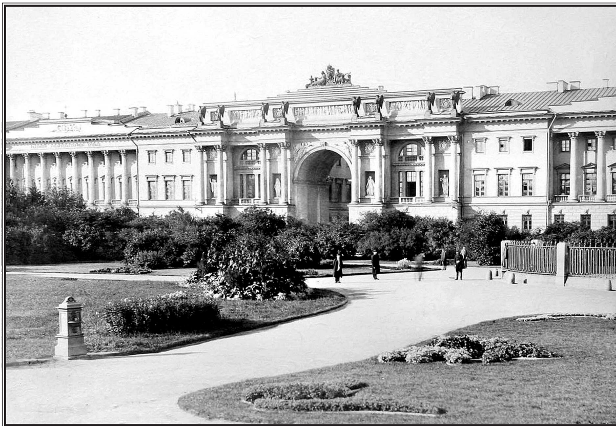
Фотография части Сенатской площади со зданиями Сената и Святейшего Синода.