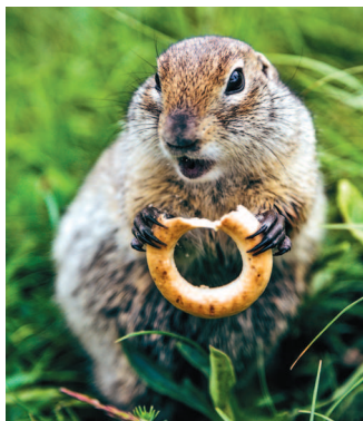
■ Суслик в Джилы-Су