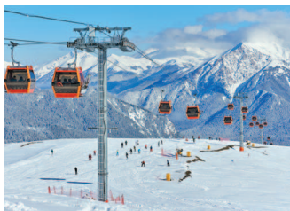
■ Горнолыжный курорт в Архызе