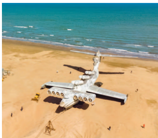
■ Экраноплан «Лунь» в Дагестане