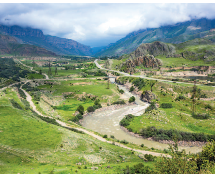
■ Баксанское ущелье летом

На Кавказе функционируют несколько парашутов, самый популярный из которых находится в Чегеме. Двадцатиминутный полет в тандеме с инструктором обойдется в 5–10 тыс. Реки Кавказа идеально подходят для занятий рафтингом . Пороги здесь не такие сложные и агрессивные, поэтому удобно оттачивать мастерство.