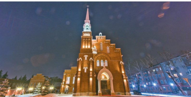
■ Северо-Осетинская государственная филармония во Владикавказе

1 Отправиться на спектакль в один из театров Владикавказа. Этот город — культурный феномен Кавказа, здесь находятся семь профессиональных театров. Многие спектакли идут на осетинском, и это как нельзя лучше помогает окунуться в национальный колорит республики.