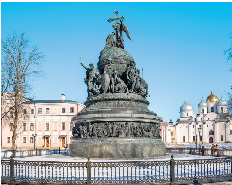
Монумент Тысячелетию России