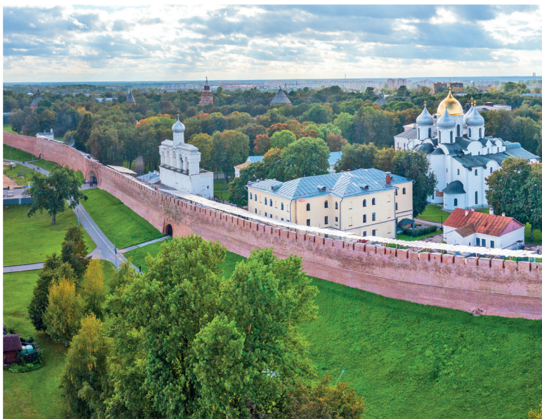
Панорама на Новгородский кремль

Новгород не знал монгольского разорения, благодаря чему здесь сохранились древние храмы и сложились уникальные школы иконописи и зодчества. Он давно уже вышел за свои средневековые границы, оброс новостройками, но самое интересное здесь по-прежнему лежит внутри крепостных валов по обеим сторонам Волхова, а до любого из пригородных монастырей не более часа-полтора неспешной прогулки. Тысячелетнюю историю города можно увидеть, услышать в перезвоне колоколов и даже потрогать руками. В 1992 году 37 объектов Великого Новгорода были включены в Список Всемирного культурного наследия ЮНЕСКО.