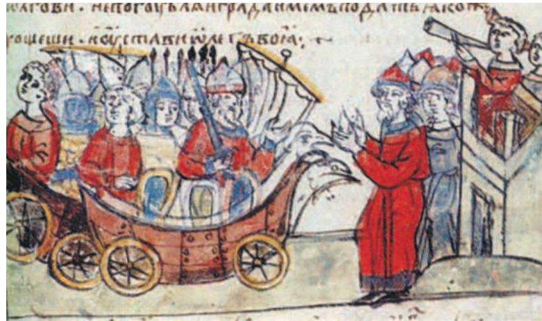
Корабли на колесах. Миниатюра из «Радзивилловской летописи». На иллюстрации изображены корабли Олега, поставленные им на колеса во время похода на Царьград в 907 г.

Упоминание о походе на Византию 907 г. можно встретить в любом учебнике по истории средневековой Руси. Но следует заметить, что многие историки считают его легендой. О нем не встречается ни одного упоминания у византийских авторов, хотя они подробно описали похожие набеги в 860 и 941 гг. Сомнения вызывает и сам договор от 907 г., который уж больно похож на договор с той же Византией от 911 г., приводимый в «Повести временных лет». Далее, описание возвращения русов с богатой добычей («даже паруса на их ладьях были из золотого шелка») сравнивают с возвращением из похода норвежского короля Олафа Трюгвасона, описанным в норвежской саге XII в.: «Говорят, после одной великой победы повернул он домой в Гарды (Русь); они плыли тогда с такой большой пышностью и великолепием, что у них были паруса на их кораблях из драгоценных материй, и такими же были и их шатры».