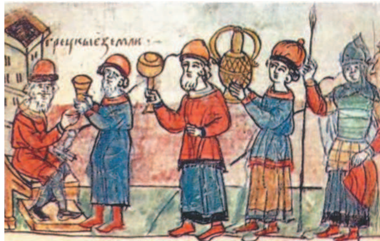
Византийцы подносят дары русскому князю Олегу. Древнерусская миниатюра.