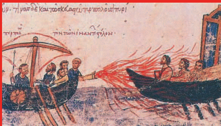
Использование «греческого огня». Миниатюра из «Мадридской рукописи» — произведения византийского хрониста XI—XII вв. Иоанна Скилицы.

Представление о морском могуществе Византии дают следующие факты. Еще в середине VII в. император Константин V послал в устье Дуная для ведения боевых действий против болгар 500 судов, а в 766 г. — даже свыше 2000. Самые крупные корабли (дромоны) с тремя рядами весел брали на борт до 100—150 воинов и примерно столько же гребцов. В VII в. византийцы стали применять в морских сражениях «греческий огонь» — смесь селитры, нефти, горючих масел, серы, изобретенный инженером и архитектором Каллиником. Смесь выбрасывалась из сифонов в виде бронзовых чудовищ с разинутыми пастьми. Сифоны можно было поворачивать в разные стороны. Выбрасываемая жидкость самовоспламенялась и горела даже на воде. Именно при помощи «греческого огня» византийцы отбили два арабских вторжения — в 673 и 718 гг., а также уничтожили флот киевского князя Игоря в 941 г.