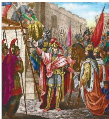
Олег в честь своей победы вешает щит над воротами Константинополя.

Поход на Византию в 911 г. также оказался удачным: Царьград был повержен и принял условия Олега. По договору Византия была обязана разрешить послам русского князя, его боярам и купцам посещать Константинополь. При этом им устанавливалось особое содержание и определялось место проживания (один из монастырей). Договор предусматривал беспощинную торговлю русов в Византии, снабжение их для обратного пути корабельными снастями и провиантом.