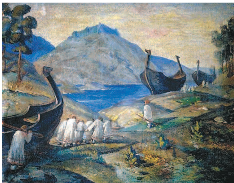
На картине Н. К. Рериха «Волокуч волоком» изображено перетаскивание древними русами своих судов между двумя реками.