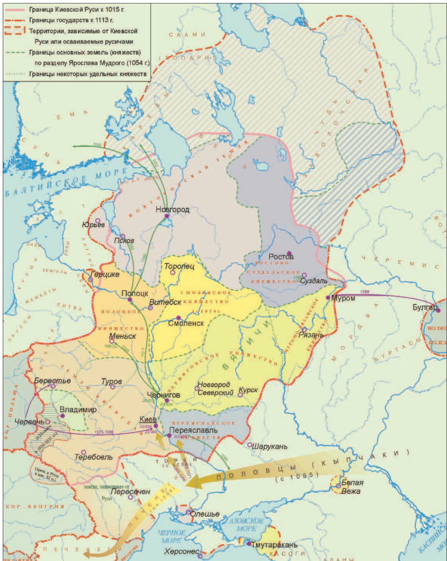
Древнерусское государство в X—XI вв.