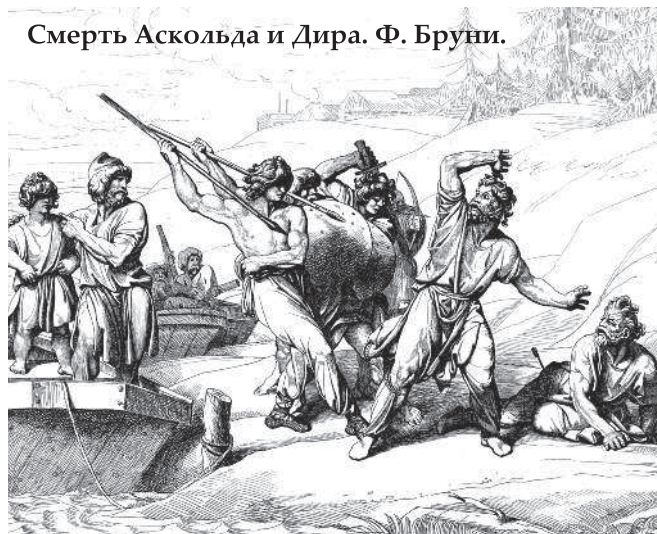
Смерть Аскольда и Дира. Ф. Бруни.

В 879 г. легендарный князь Рюрик скончался, а его сыну Игорю едва исполнился год. Перед смертью Рюрик успел назначить опекуном мальчика своего родственника Олега. Тот и стал княжить в Новгороде. В 882 г. Олег со своей дружиной захватил Киев. В состав его войска входили новгородские словене, кривичи, чудь, весь, а также наемники-варяги. Убив правивших в Киеве Аскольда и Дира, Олег объявил этот город столицей всей русской державы.