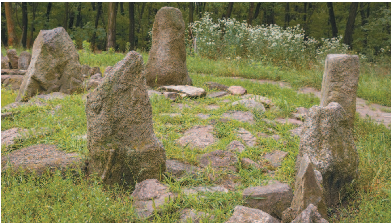
Славянское языческое святилище на острове Хортица на Днестре, Украина.