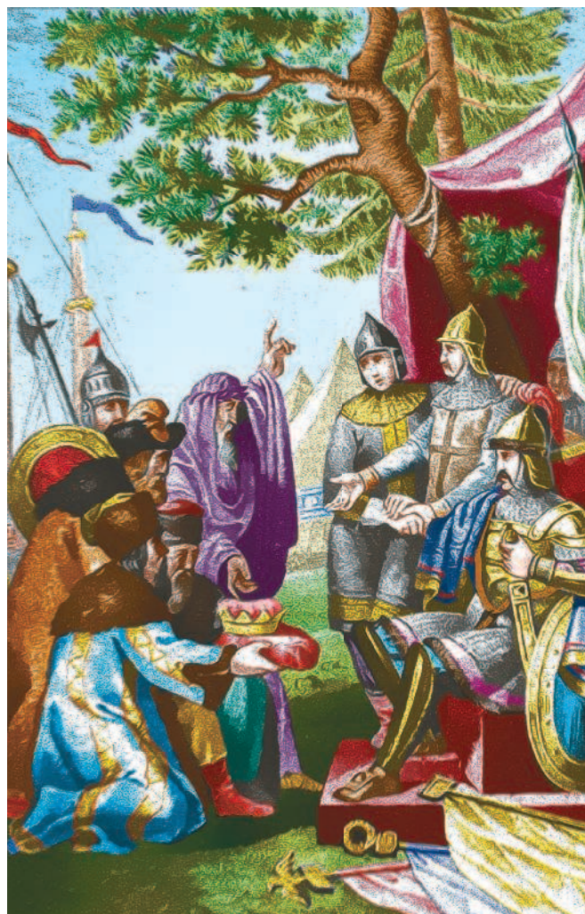
Рюрик, Синеус и Трувор принимают славянских послов, призывающих их на княжение. 862 г.

С какой целью Рюрик с братьями прибыли в славянские города?