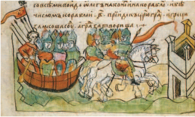
Поход Вещего Олега с дружиной на Царьград. Миниатюра из «Радзивилловской летописи». XII в.