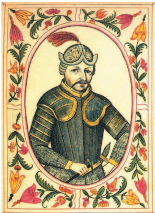
Рюрик, великий князь новгородский в 862—879 гг. Портрет из «Царского титулярника». 1672 г.

Рюрик был сыном ободритского князя Годолуба (ободриты — союз группы западнославянских племен), который погиб в бою в 808 г.