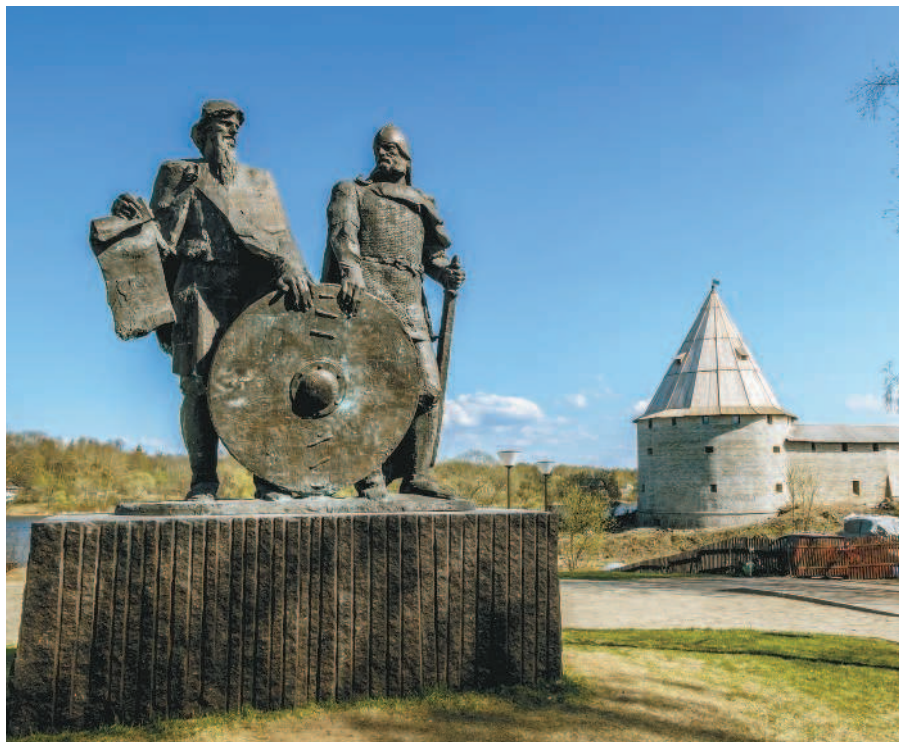
Памятник князьям Рюрику и Вещему Олегу в Старой Ладоге.