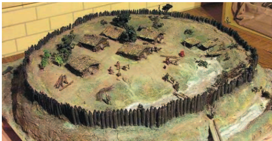
Поселение древних славян. VII—IX вв. Реконструкция.

Самые ранние письменные источники, рассказывающие о славянских племенах, относятся к I—II вв. н.э. и принадлежат римским авторам Тациту, Плинию и Птолемию. В те времена славяне, называемые венетами, населяли территории в бассейне реки Вислы и побережье Балтийского моря. Первые восточные славяне (анты) во II—V вв. стали селиться на обширной территории от Западного Буга до Днепра. Они жили общинно-родовым строем, занимались преимущественно земледелием, а также разведением скота, охотой, сбором дикого меда, грибов и ягод. В IV в. образовался первый племенной союз восточных славян, который возглавили волыняне (они же дулебы и бужане).