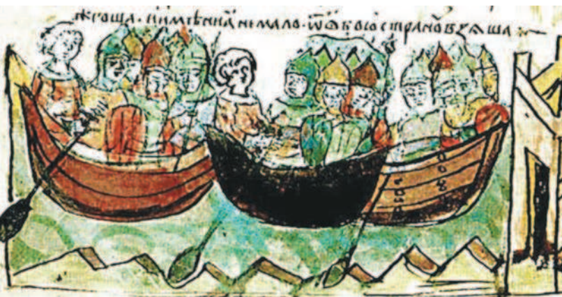
Поход князя Игоря на Константинополь в 941 г. Миниатюра из «Радзивилловской летописи».

В отношениях с Византией Игорь продолжил политику своего предшественника. Грекам, вероятно, не нравились условия договора с Олегом. Возможно, они их не выполняли. Так или иначе, в 941 г. Игорь снарядил военный флот и отправился в Византию. Однако ему не удалось, как Олегу, приблизиться к стенам Константинополя, ибо греческий полководец Феофан сжег большую часть судов Игоря.