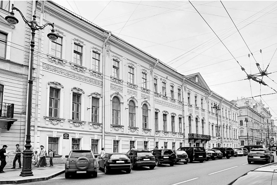
Малая Морская улица, 10

тери законного наследства и получили причитающиеся блага незадолго до собственной смерти), и сюжет (в свете ходил анекдот, рассказанный Пушкину внуком Голицыной, о том, что в парижской молодости, когда она бывала при дворе самой Марии Антуанетты и проигралась в фараон, авантюрист граф де Сен-Жермен открыл ей три заветных карты, гарантирующих выигрыш). Но самое главное совпадение повести и реальности — этот дом.