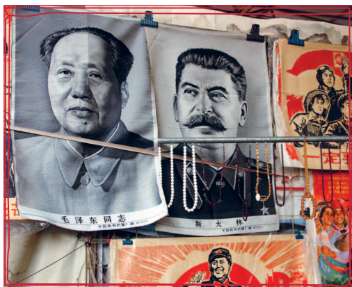
На рынке Паньцзяюань в Пекине.

С 1931 года учащаются нападения Японии на Северный Китай. В 1932 году на территории захваченной Маньчжурии Япония создает марионеточное государство Маньчжоу-Го во главе с последним императором династии Цин Пу И. В 1937 году вторжением