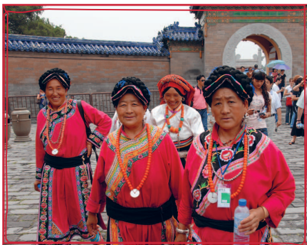
На улицах Пекина.

было больше приверженцев. По его приказу был построен новый Императорский дворец, общая планировка которого сохранилась до наших дней, а также он является самым большим дворцовым комплексом в мире.