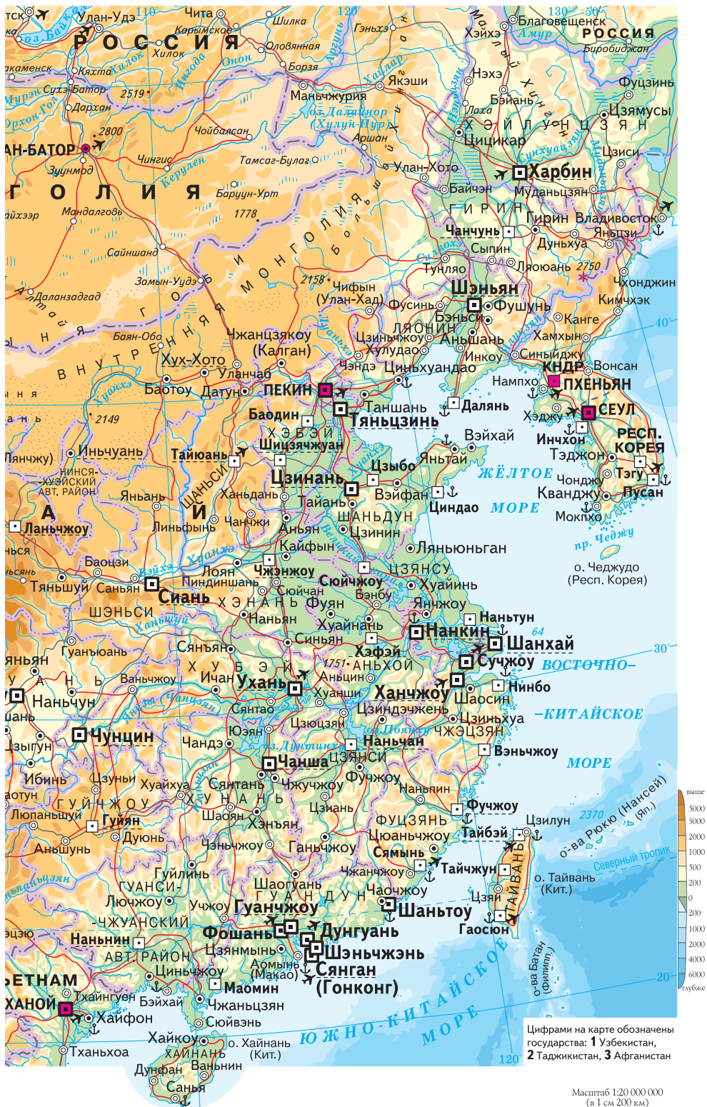
Масштаб 1:20 000 000 (в 1 см 200 км)