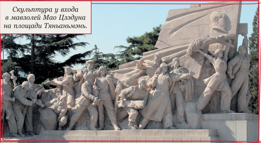
Скульптура у входа в мавзолей Мао Цзэдуна на площади Тяньаньмэнь.

В 246 г. до н. э. Ин Чжэн, которому в то время было всего 13 лет, стал правителем царства Цинь и воевал, не переставая, практически до 221 г. до н. э., когда, покорив остальные царства, провозгласил себя Цинь Шихуанди («великий император основатель Цинь», которым он оставался до своей смерти в 206 г. до н. э.). При нем начали возводить Великую стену, для этого объединяли отдельные участки прежних крепостных стен. Он унифицировал написание иероглифов, ширину дорожной колеи и много чего другого, чем китайцы пользуются до сих пор. Он ввел и общий термин для обозначения подданных — «черноголовые». Если не считать египетские пирамиды, то у него самая потрясающая гробница в мировой истории — Терракотовая армия под Сианем (читайте о ней в соответствующей главе).