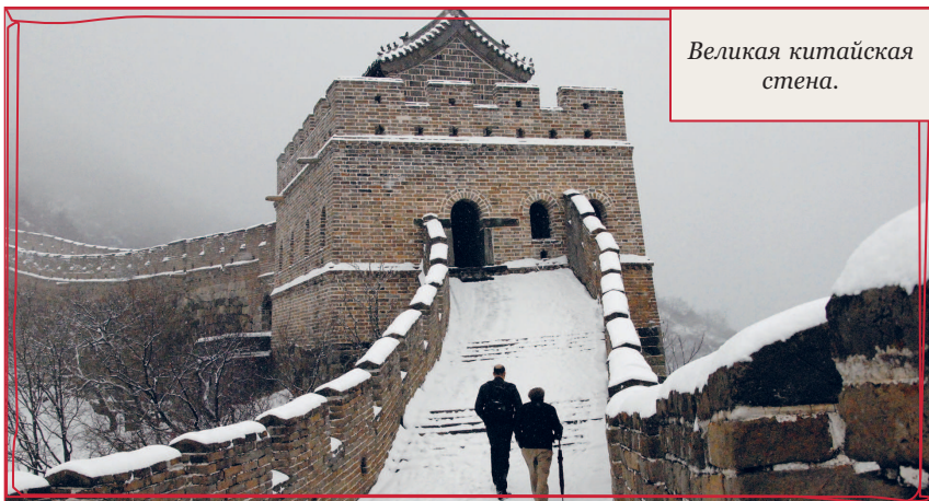
Великая китайская стена.

Добро пожаловать в Китай! Он не может не понравиться.