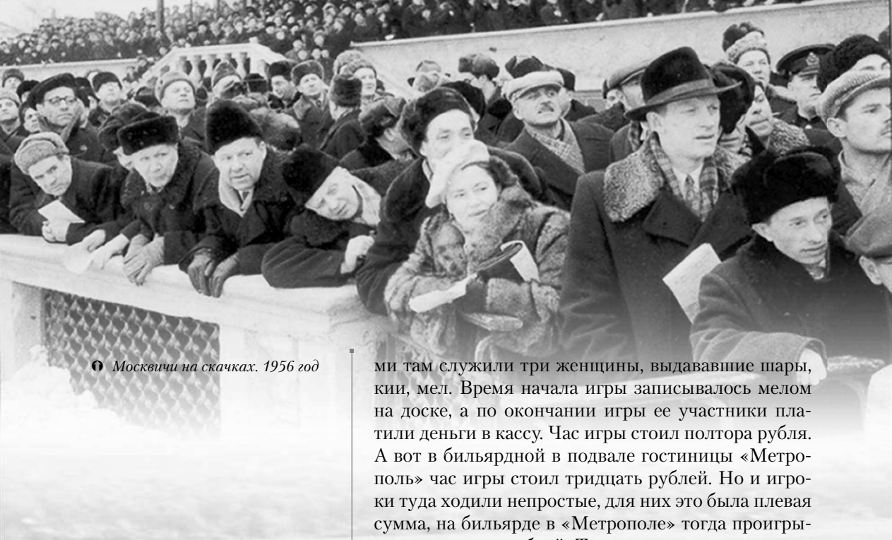
🕒 Москвичи на скачках. 1956 год