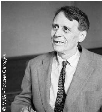
➊ Иван Александрович Пырьев