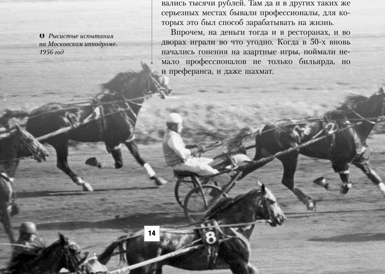
🕒 Рысистые испытания на Московском ипподроме. 1956 год

ми там служили три женщины, выдававшие шары, кии, мел. Время начала игры записывалось мелом на доске, а по окончании игры ее участники платили деньги в кассу. Час игры стоил полтора рубля. А вот в бильярдной в подвале гостиницы «Метрополь» час игры стоил тридцать рублей. Но и игроки туда ходили непростые, для них это была левая сумма, на бильярде в «Метрополе» тогда проигрывались тысячи рублей. Там да и в других таких же серьезных местах бывали профессионалы, для которых это был способ зарабатывать на жизнь.