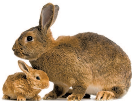
Крольчиха с крольчонок