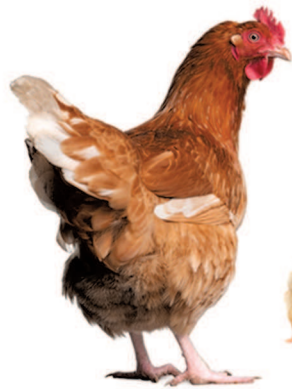
Курица с цыплёнком