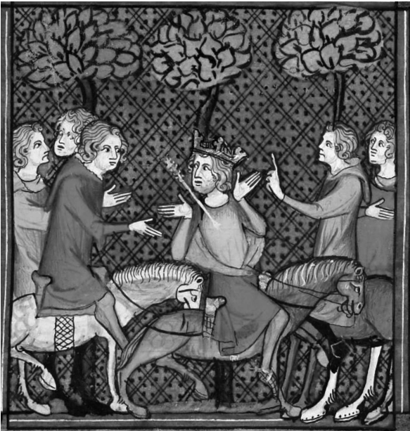
Вильгельм Второй со стрелой в груди. Миниатюра 13-го века

Думаете, был благочестивым и набожным? А вот ни фиги! Все годы своего правления он открыто хамил церкви и всячески демонстрировал ей свою власть. Поощрял и насаждал насилие и жестокость. Воевал не только с Шотландией и Уэльсом, но и с родным братишкой старшеньким, Робертом,