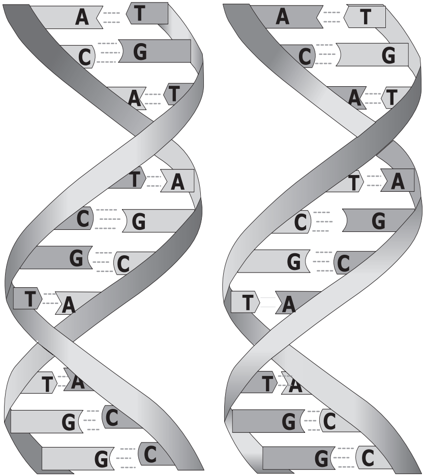
Рис. 1. ДНК