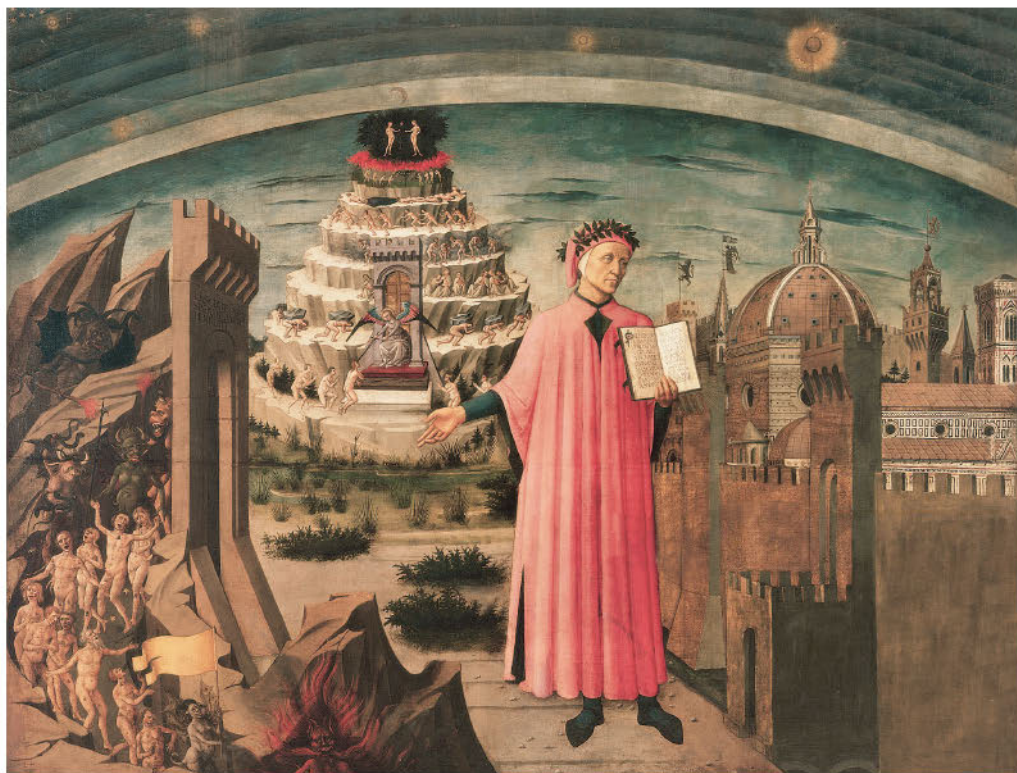
Данте и его «Божественная комедия». Фрагмент картины Доменико ди Микелино. 1465

классической древности, или Первый век гуманизма», датированной 1859 годом и появившейся спустя четыре года после того, как Ж. Мишле написал свою книгу «Возрождение». Аналогичных взглядов на содержание исторического процесса придерживался и Я. Буркхардт; они выражены в его знаменитом сочинении «Культура Италии в эпоху Возрождения», впервые изданном всего годом позже работы Г. Фогта, но по сравнению с ней заслужившем позднее гораздо больший авторитет и более широкую известность.