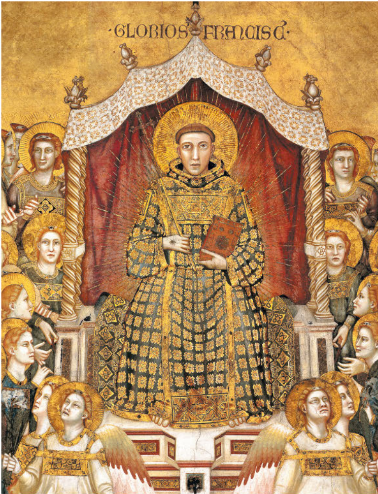
Св. Франциск Ассизский. Фрагмент фрески Джотто. Верхняя церковь Сан-Франческо в Ассизи. Между 1296 и 1303

веры и разума. В соответствии с этим принципом допускалась возможность, признав факт объективного существования мира, рационально доказать бытие Бога и отклонить тем самым возражения против истин веры. Эта идея оказалась созвучной некоторым положениям учения гуманистов. В отличие от Франциска Ассизского, Фома Аквинский не считал богатство само по себе греховным и учил только умеренно пользоваться им, придерживаясь правила «золотой середины» 5 .