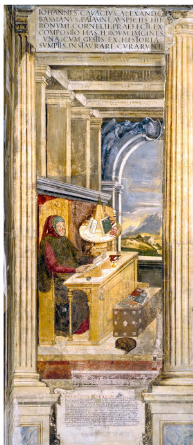
Франческо Петрарка в кабинете. Фреска неизвестного художника в Зале гигантов в Падуе. Последняя четверть XIV в.

на темы деяний св. Франциска, созданных в церкви монастыря в Ассизи на рубеже XIII и XIV веков Джотто ди Бондоне (1267/1277–1337). Именно у Джотто персонажи его композиций начинают освобождаться от бесплотности их средневековых предшественников и приобретают не только пластичность, которой обладает живое человеческое тело, но и убедительное правдоподобие движений и жестов человека, способных выразить его эмоции; это и заставляет зрителя проникаться ощущением реальной достоверности того, что изображает художник. Так мирское, жизненное, человеческое начало входит в искусство того времени, которое непосредственно предшествует преобразовательной деятельности Франческо Петрарки (1304–1374), явившегося, о чем уже было сказано выше, основоположником ренессансного гуманизма как вполне определенной системы мировоззренческих взглядов.