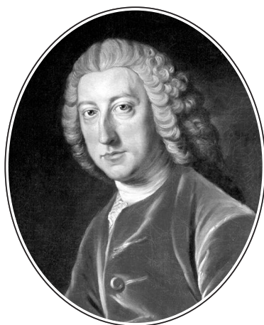
Премьер-министр Великобритании Уильям Питт Старший, 1-й граф Чатам (1708–1778)

При этом Дания непременно должна была рано или поздно примкнуть к этому союзу трех великих держав: при своем положении на континенте, и особенно при обладании береговой полосой у Скагеррака и Каттегата, Дания должна была играть существеннейшую роль прямой морской связи между Англией, Пруссией и Россией при всяком предприятии этого будущего союза против Швеции, где влияние Франции было так сильно. Что же мудреного, если именно в Дании агитация графа Чатама и сторонников его программы должна была сказываться особенно сильно