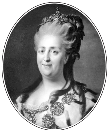
Императрица и самодержица Всероссийская Екатерина II Алексеевна (1729–1796)

нистр иностранных дел) были осыпаны подарками со стороны версальского двора. Даже и от польских конфедератов им перепадало, хотя шедшие оттуда деньги, к живому прискорбию константинопольских сановников, в значительном проценте застревали по дороге в карманах передатчиков.