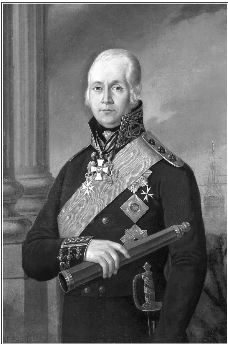
Портрет адмирала Федора Федоровича Ушакова. С портрета художника П. Н. Бажанова. 1912 г.