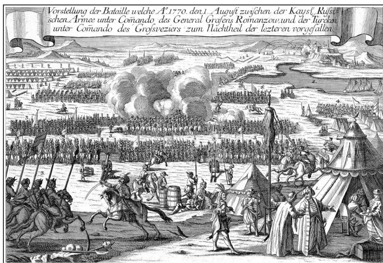
Сражение при Кагуле.

Гравюра И. М. Вилла. Между 1770 и 1780 гг.