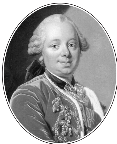
Премьер-министр Франции Этьен-Франсуа де Шуазель (1719–1785)

Эта тайная дипломатия (« le secret du roi » — «королевский секрет») иногда действовала в унисон с официальной, а иногда ей перечила и очень путала все расчеты Шуазеля 3 . Но в одном пункте они никогда не расходились: в упорном стремлении на всех путях становиться поперек дороги и всячески мешать Екатерине и в Швеции, и в Польше, и в Турции. Большие экономические интересы связывали французскую торговлю и промышленность с рынками турецкого Леванта, то есть со всеми странами, омываемыми Черным морем; интересы политические, борьба за влияние на севере и в центре Европы — все это заставляло Францию