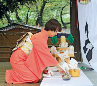
■ Чайная церемония

О существовании Японских островов Европа узнала только в начале XIV века от венецианского купца Марко Поло, который совершил путешествие в Китай. Самих островов Поло не видел, поэтому говорил о них как о Чипангу – Стране, где рождается солнце. Сами японцы до IX века называли свою страну Ямато – Большая гармония, а с X века – Нифон или Ниппон. В 1946 году Конституционная комиссия признала оба названия одинаково правомочными. Но когда в 1960-е годы страна готовилась к XVIII Олимпийским играм, вновь стал вопрос о названии. И Олимпийский комитет высказался за Ниппон – Начало Солнца. С тех пор именно так сами японцы называют свою страну. Ее флаг – красный солнечный диск на белом полотнище, и белый цвет говорит о чистоте помыслов, а солнце, как известно, символ японских императоров, ведущих свою родословную от богини солнца Аматэрасу. Когда японский флаг поднимается на флагштоке, звучит государственный гимн, начинающийся словами Кими га ё ва , что примерно означает «Пусть продлится Ваше господство». Под словом «Ваше» подразумевается, естественно, император. Официального герба страны не существует. В качестве него часто