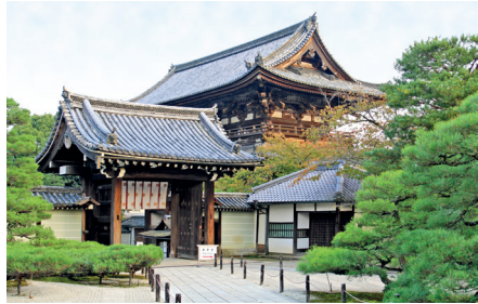
■ Киото, храм Ниннадзи

О существовании Японских островов Европа узнала только в начале XIV века от венецианского купца Марко Поло, который совершил путешествие в Китай. Самих островов Поло не видел, поэтому говорил о них как о Чипангу – Стране, где рождается солнце. Сами японцы до IX века называли свою страну Ямато – Большая гармония, а с X века – Нифон или Ниппон. В 1946 году Конституционная комиссия признала оба названия одинаково правомочными. Но когда в 1960-е годы страна готовилась к XVIII Олимпийским играм, вновь стал вопрос о названии. И Олимпийский комитет высказался за Ниппон – Начало Солнца. С тех пор именно так сами японцы называют свою страну. Ее флаг – красный солнечный диск на белом полотнище, и белый цвет говорит о чистоте помыслов, а солнце, как известно, символ японских императоров, ведущих свою родословную от богини солнца Аматэрасу. Когда японский флаг поднимается на флагштоке, звучит государственный гимн, начинающийся словами Кими га ё ва , что примерно означает «Пусть продлится Ваше господство». Под словом «Ваше» подразумевается, естественно, император. Официального герба страны не существует. В качестве него часто