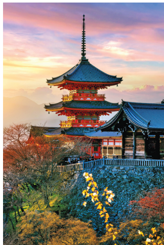
■ Киёмидзу-дэра, Киото