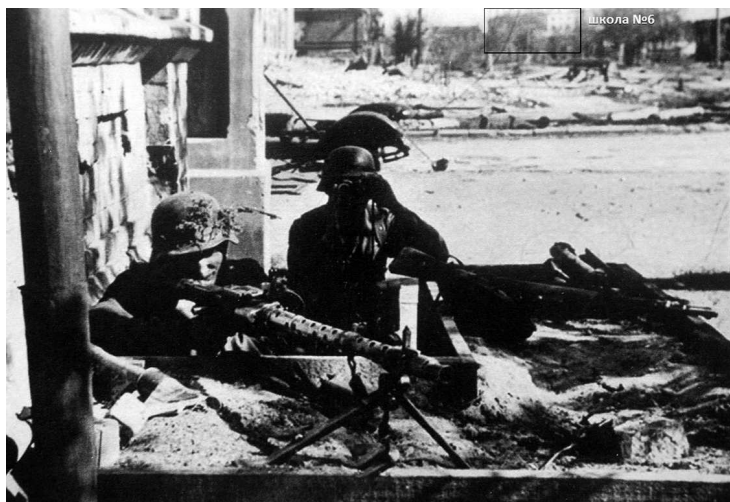
Пулеметный расчет на улице Саратовской, сектор обстрела направлен на юг. С севера фланг 71-й пд прикрывают части 295-й пд, пехота которой в 14:00 вышла к водонапорным бакам на вершине и заняла юго-западные склоны Мамаева кургана