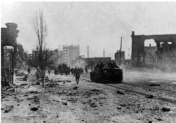
Самоходки из 244-го дивизиона с десантом 194-го пехотного полка на ул. Курской. Машины нагружены ящиками с боеприпасами, рядом идут военнопленные «хиви» с шанцевым инструментом. Вдали виден «дом специалистов»

Немецкая разведка, промчавшись мимо привокзальной площади и достигнув площади Павших Борцов, чуть было не выехала к командному пункту 62-й армии на ул. Пушкинской. Огонь открыли работники штаба и бойцы армейского заградотряда. Не вступая в бой, бронетранспортеры разведывательного батальона рванули дальше к Волге, к переправе № 2. Одна из бронемашин доехала аж до спуска на Астраханский мост через р. Царицу, где подорвалась на mine.