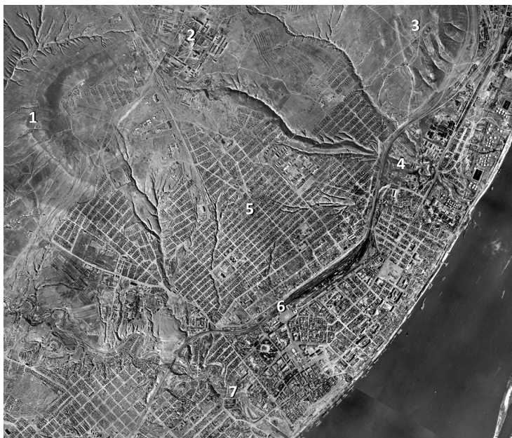
Немецкое аэрофото от 17.09.42. Центральный (Ерманский район) Сталинграда. Схема расположения объектов: 1 — высота 112.5; 2 — Авиагородок; 3 — высота 102.0 (Мамаев курган, район баков); 4 — овраг Долгий; 5 — т. н. «заполотновский» район; 6 — вокзал Сталинград I; 7 — долина реки Царицы

выдержав напряжение боя, заряжающий И. Е. Макосов покинул танк и сбежал. Починив под огнем гусеницу и маневрируя под бомбами, экипаж (механик-водитель И. М. Ляшенко и радист Норкин, инициалы не известны) поврежденной машины вышел из боя и занял позицию около зданий Военно-политического училища. Ночь закончилась, не успев начаться, и рано утром двадцатидвухлетний лейтенант, глядя воспаленными глазами на пикирующих «лаптежников», с тоской подумал, что пережить день ему вряд ли удастся (эпизод боя описан в воспоминаниях Л. И. Целуйко. — Прим. авт. ).