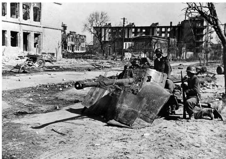
Расчет немецкого 50-мм противотанкового орудия Pak 38 на перекрестке улиц Саратовская и Курская. Немцы ждут атаки с юга, где в районе площади Павших Борцов слышна перестрелка