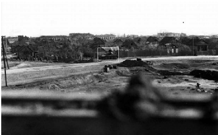
Одна из уничтоженных машин 6-й тбр, перекресток улиц Невской и Карской, т. н. «заполотновский» район.

сар по приказу командарма Чуйкова были расстреляны на следующий день.