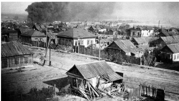
Частный сектор севернее площади 9 января, так называемые «Балканы». Вдали виднеется пяти-шестиэтажное здание, известное из сводок 13-й гв сд как «г-образный дом» и недостроенный «дом железнодорожников».

ревянную застройку от кирпичных многоэтажных зданий центра Сталинграда. Батальоны 295-й пд продвигались вдоль южных склонов Мамаева кургана и двух оврагов Долгий и Крутой, ведущих прямо к Волге. Командование 6-й армии вермахта радостно докладывало в ОКХ: «Наступление LI армейского корпуса в центре Сталинграда, несмотря на жестокие уличные бои, идет успешно. 71-я и 295-я пехотные дивизии с высот на окраине через жилые кварталы широким фронтом продвинулись на юго-восток и восток. В 12.00 взят городской вокзал» (В немецких документах время указано по Берлину. — Прим. авт.).