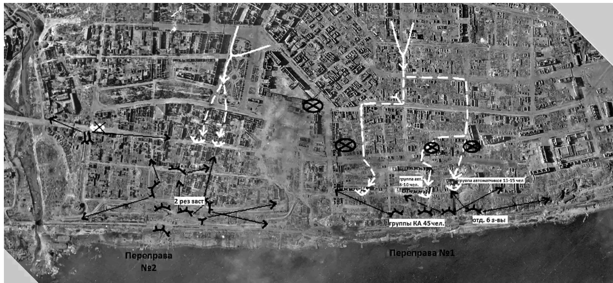
Перенесенная на аэрофотографию оригинальная схема расположения застав 79-го погранполка и движения передовых немецких частей в центре города, в названии недоставало части карты