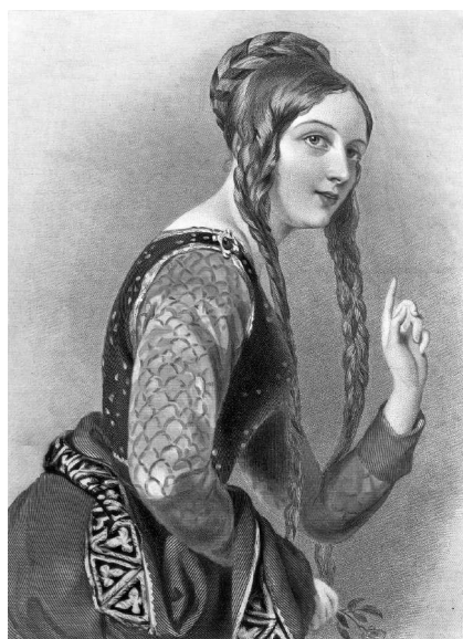
Неизвестный художник. Алиенора Аквитанская. Гравюра. 1850-е гг.

похода (1147–1149), который красавица королева явно рассматривала как веселое приключение. Развод в XII в. в католической стране был делом трудным, но оскорбленный муж добился разрешения римского папы на расторжение брака (а значит, на потерю огромных богатых владений на юго-западе, которые принадлежали Алиеноре по наследству и превосходили в несколько раз личные владения французского короля).