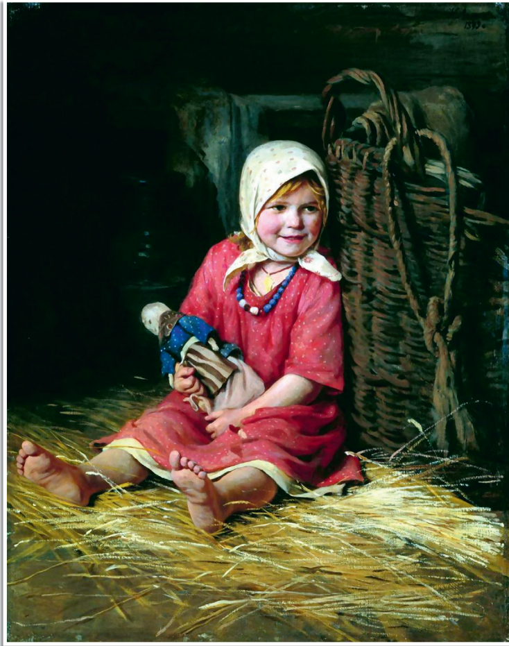
К. Лемох «Варька», 1893.

то выпадала честь спасать из плена. И уже тогда пытливые девичьи глазки высматривали себе суженого — надёжного, смелого, находчивого, сообразительного, ловкого. А мальчишки безусые, безбородые и рады были стараться!