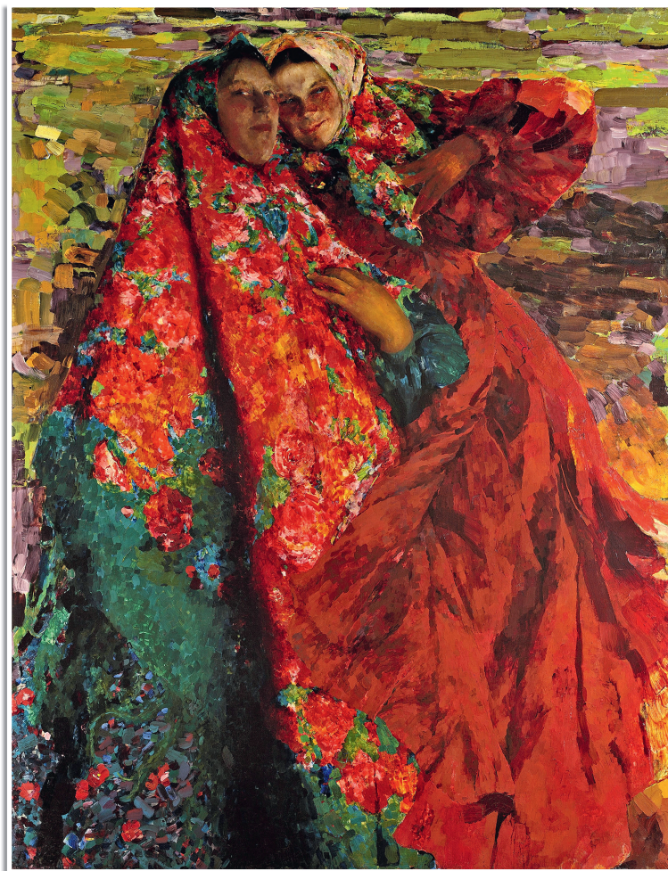
Ф. Малявин «Бабы», 1905.

Насколько эта книга современна, решать только тебе, мой дорогой читатель. Но если ты прочтёшь её, как говорят, на одном дыхании, если будешь всматриваться в многочисленные (я не поскупилась!) репродукции картин известных художников, которые во многом подтверждают мой рассказ, и раз за разом открывать для себя всё новые и новые детали, то уверена, что мы с тобой нашли друг друга. Значит, книге — жить. Значит, книге — радовать. Значит, книге — быть полезной для тебя, живущего в XXI веке.