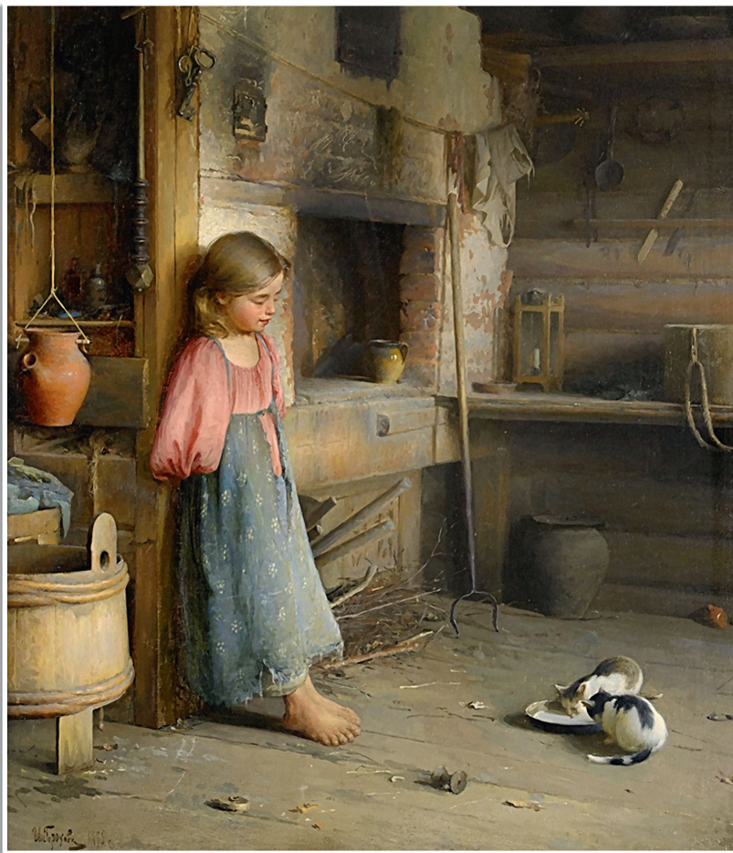
И. Горохов «Молоко для котят», 1895.

всё: доить коровушек, сбивать масло, полоть грядки, печь хлеб. Она спокойно управлялась с бельём у речки, выходила в поле, чтобы, как и взрослые, жать, косить, метать сено. Считалось, что это и есть главное приданое девушки на выданье — быть трудолюбивой, выносливой, ловкой, сноровистой, знать женские домашние премудрости, ведь «хозяйство вести — не сумой трясти» .