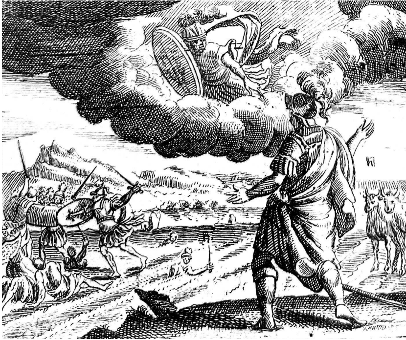
Кадм и зубы дракона. «Овидиевы фигуры», XVII в.

части картинки. Из современных энциклопедий по античной мифологии можно узнать, что часть этих волшебных зубов достается и Ясону в качестве испытания.