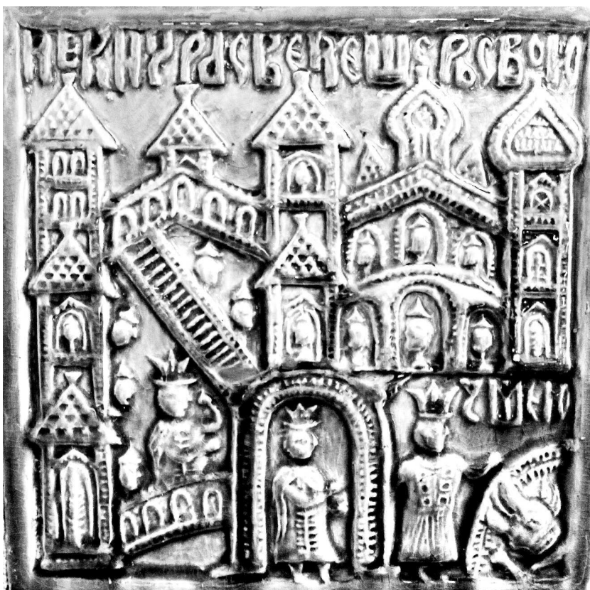
Некий царь сведе дочь свою змею. Муравленный изразец, XVII в.

и на заднем плане намечены зрители душераздирающей сцены, которая, судя по многочисленным копиям, явно интересовала и забавляла реальных людей XVII–XVIII вв. В другом варианте этого изразца [39] царевна стоит в проеме, а царь изображен возле норы, словно дающим чудищу зарок, а потом и среди зрителей (то есть в одной картинке совмещаются разные моменты, что характерно для древнерусской иллюстрации). Но как бы ни переосмыслились человеческие фигурки при копировании изразцовой формы, как бы ни стирался,