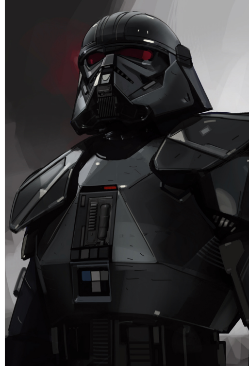
↑ ПОРТРЕТ ТЁМНОГО ШТУРМОВИКА. ВАРИАНТ 158 Матяш