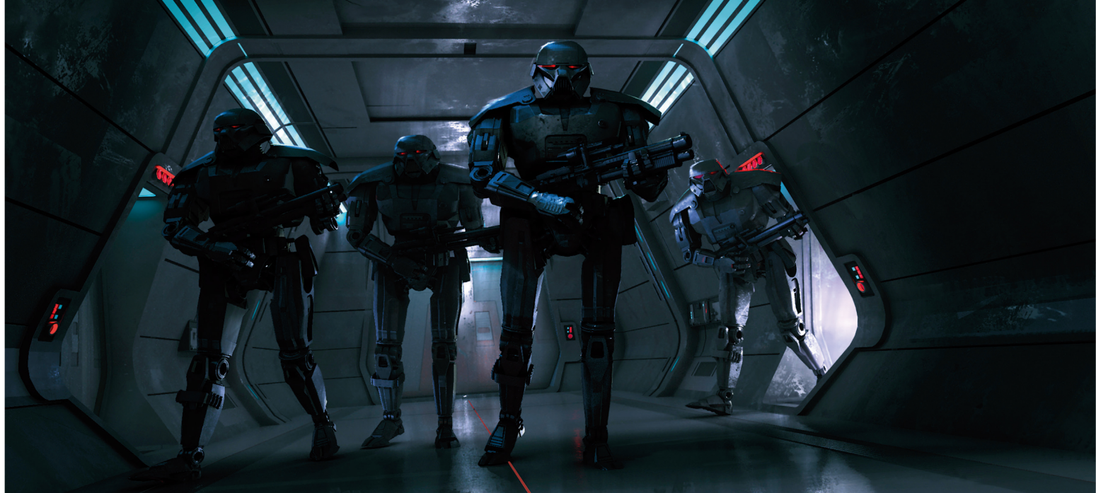
↑ ВТОРЖЕНИЕ НА МОСТИК. ВАРИАНТ 277 Чёрч