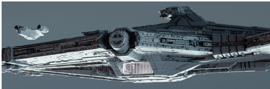
↑ ИМПЕРСКИЙ ЛЁГКИЙ КРЕЙСЕР. ВАРИАНТ 47 Гарсия