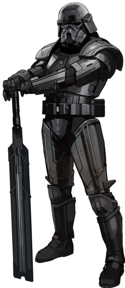
↑ ТЁМНЫЙ ШТУРМОВИК. ВАРИАНТ 154 Матяш

«У тёмных штурмовиков очень необычные механические пропорции. Поэтому труднее всего нам было перенести их в чисто кинематографическую плоскость». Чинг