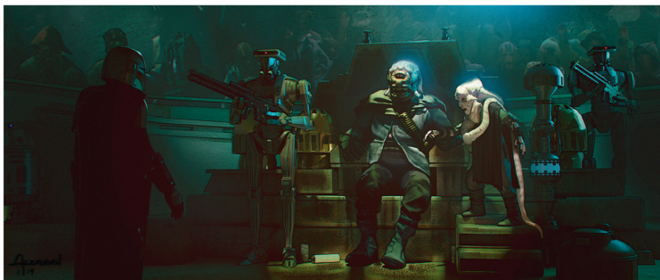
← ГОР КОРЕШ. ВАРИАНТ 02 Альцманн

→ ГЛАВАРЬ. ВАРИАНТ 02 «Гора Кореша описали как преступного воротилу мелкого пошиба, и суть состояла в том, чтобы его образ своей ретропалитрой навевал мысли о старых дизайнерах Рэя Харрихуэна». Матяш