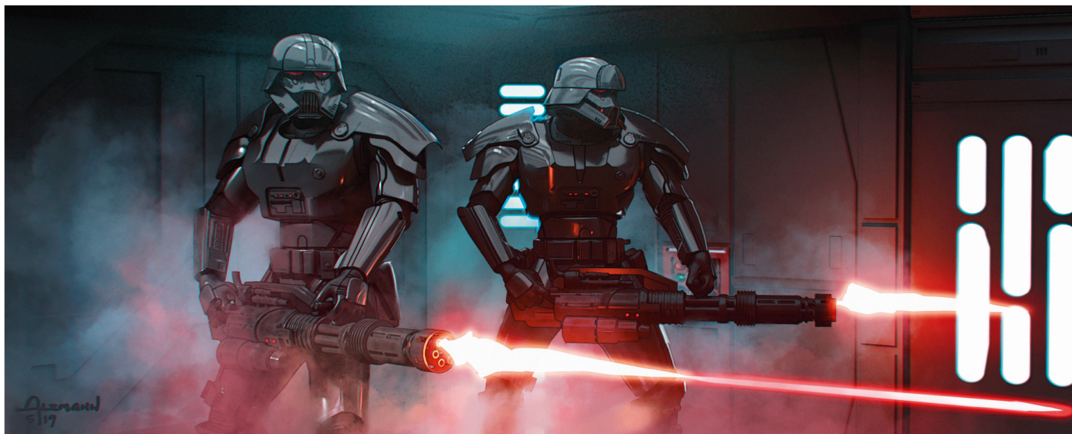
↓ ТЁМНЫЙ ШТУРМОВИК. ВАРИАНТ 115 Альцманн