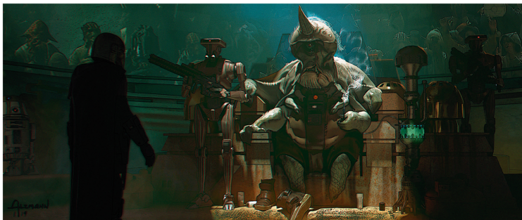
↑ ГОР КОРЕШ. ВАРИАНТ 03 Альцманн