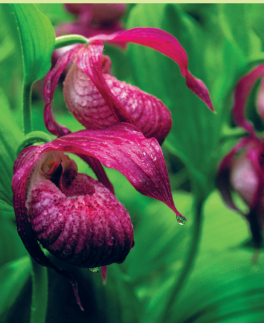
Венерин башмачок крупноцветковый (Красная книга России)