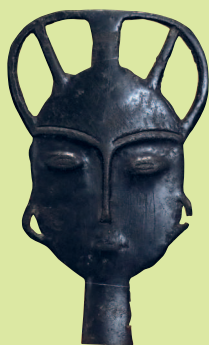
Бронзовая голова. Хунны, конец I тыс. до н.э.

Советский археолог, историк, этнограф А. П. Окладников