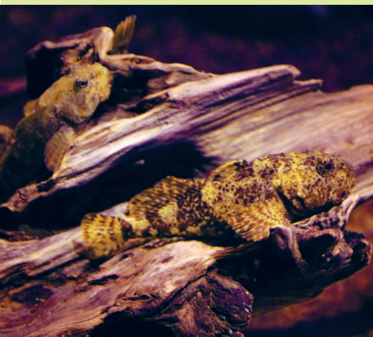
Байкальский бычок-подкаменщик, или широколобка