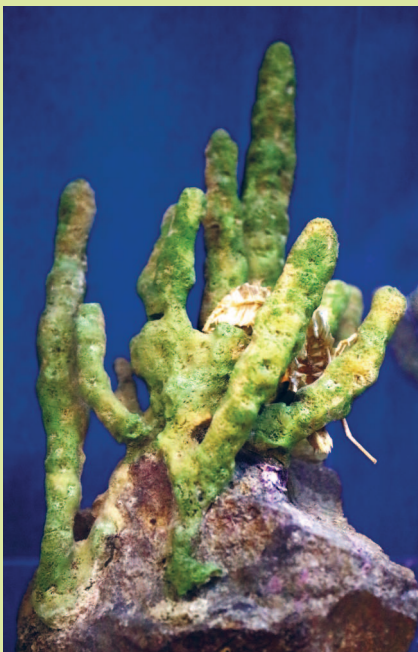
Байкальская губка любомирския байкальская