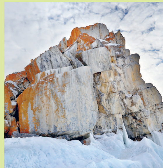
Западная оконечность священного мыса Бурхан на Ольхоне образована глыбами мрамора

Флора и фауна подводного мира озера насчитывает более 3,5 тыс. видов