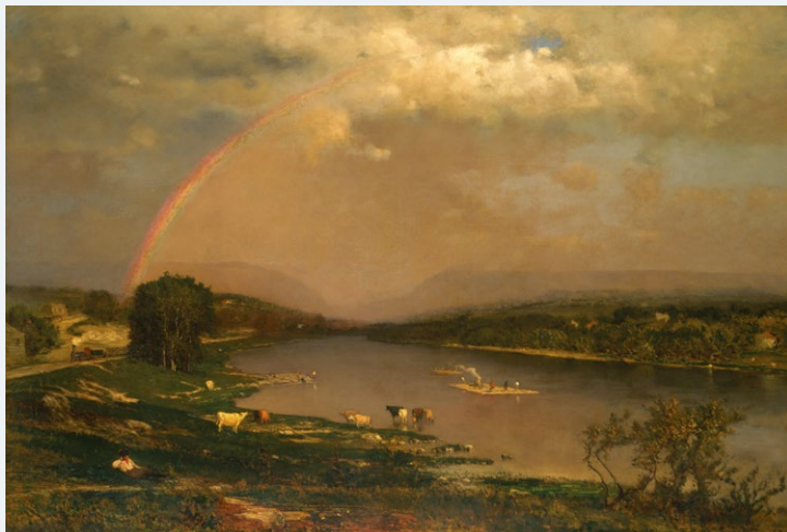
Дэлавер-Уотер-Гейп Джордж Инесс, 1867 г., холст, масло, 91,4×127,6 см, Метрополитен-музей, Нью-Йорк, США

Способность видеть цвета дает нам возможность жить в ярком и удивительно красивом мире. Именно поэтому феномен цвета с древнейших времен интересовал людей. Цвет считали священным, поклонялись ему, изучали и, конечно, украшали свою жизнь всем богатством оттенков.