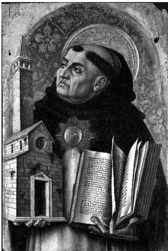
Святой Фома Аквинский Картина работы Карло Кривелли

анта: «Сумма философии» и «Сумма теологии». Он занимался проблемами познания, психологии, а труды по «пассивному» и «активному» интеллекту интересны и сегодня. Он писал о разнице между научным познанием и «сверхъестественным откровением», то есть о том же, о чем пишем и мы сейчас. О том, чему можно и чему нельзя обучить. Святой Фома Аквинский четко понимал разницу между обучением и одаренностью. В переводе на современный язык понятий это означает, что в Литинституте научить стать Пушкиным невозможно никакими усилиями. Эллинист и доминиканец,