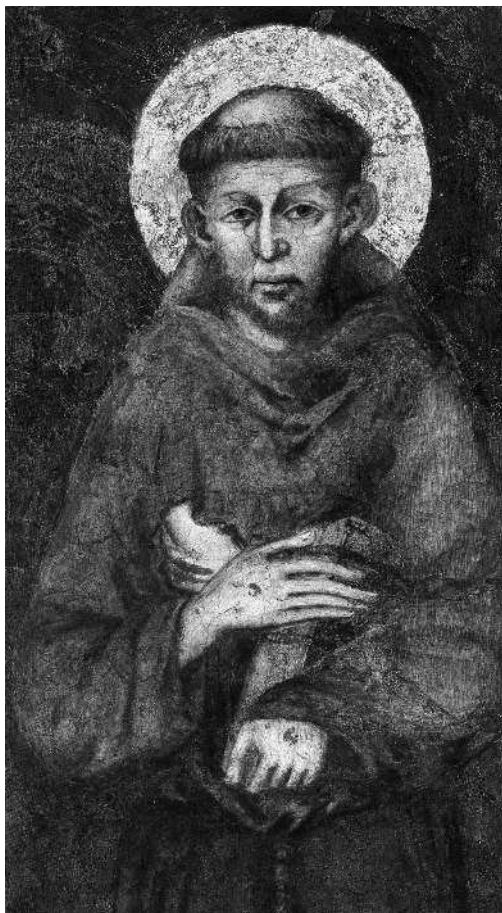
Святой Франциск Ассизский Фреска работы Джотто ди Бондоне

Тающая синева небес, тонкая очерченность холмов, пушистость раннего цветения на картинах Рафаэля, Перуджино, Пьеро делла Франческа. Весь настрой нежной, молодой, однако и твердой, таинственной земли Тосканы способствовал деятельному поэтическому гению этих мест. Тогда, на рубеже XII–XIII веков,