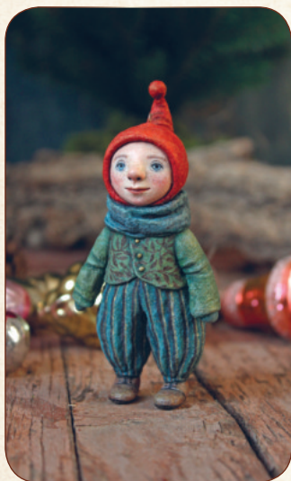
КРОХА ГНОМ 114