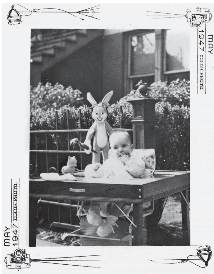
День памяти павших. Чикаго, 1947 г.