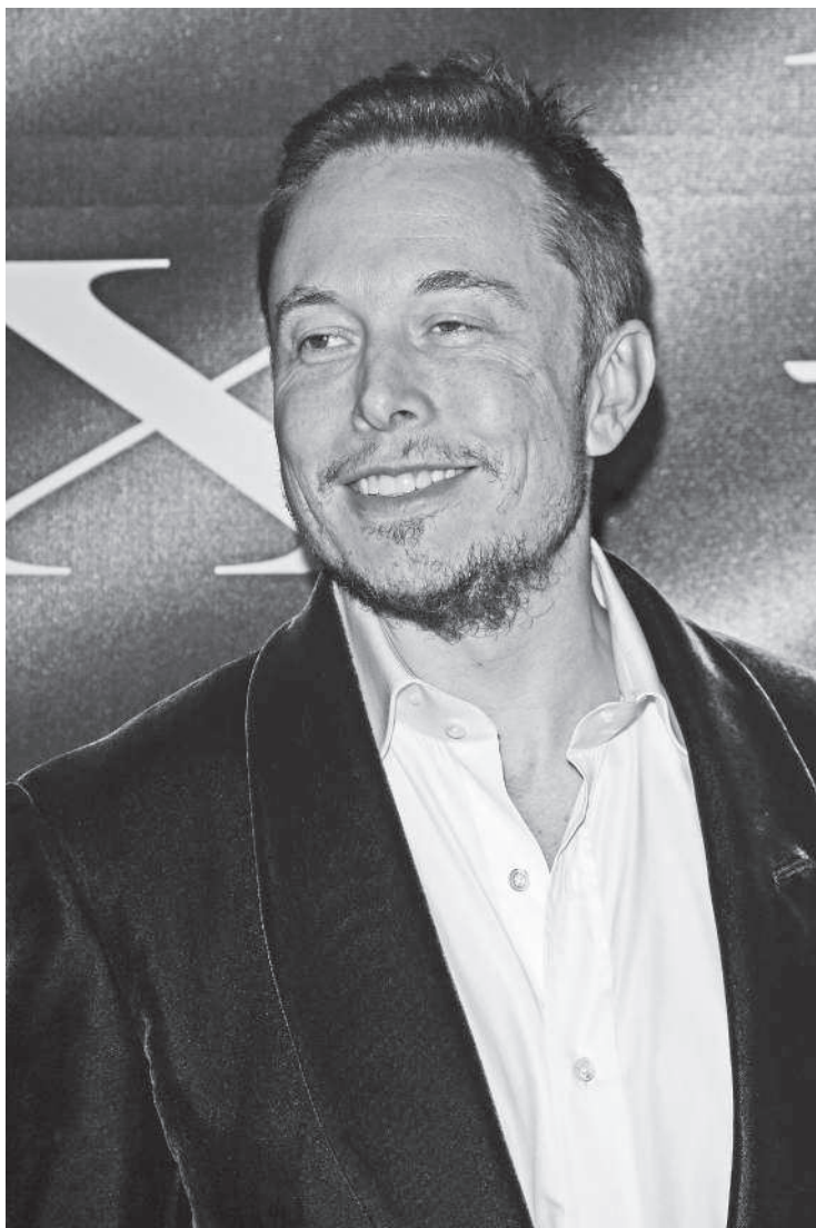
Илон Маск на презентации Tesla Model X . Лос-Анджелес, 9 февраля 2012 года