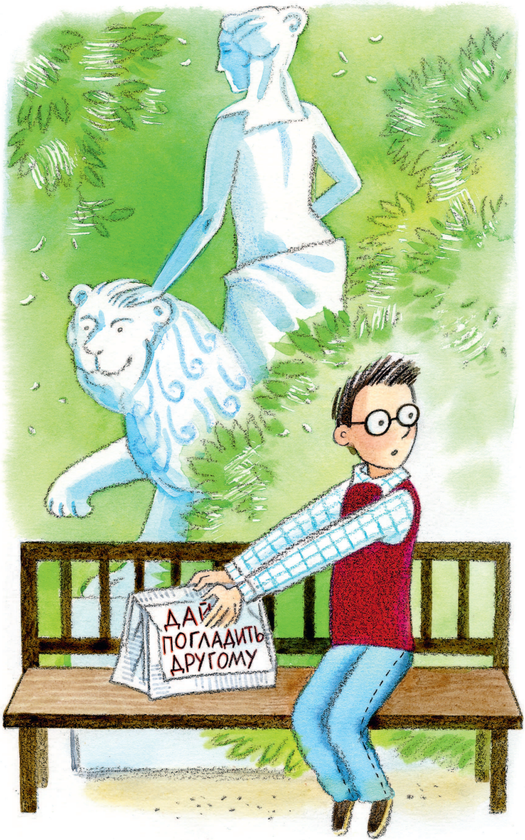
Рисунки М. Спеховой