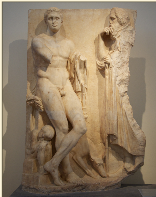
Надгробие юноши с острова Илоссос, Скопас, ок. 330 г. до н.э. / Национальный археологический музей в Афинах

Меланхоличное и размеренное настроение мы встретим не только в рельефах, но и в круглой скульптуре, где также