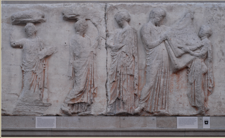
Фрагмент рельефа с фриза Парфенона с изображением Панафинейской процессии, Фидий, 438–431 гг. / Британский музей