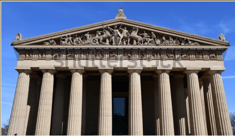
Реконструкции рельефов фронтонов Парфенона, Фидий, 438–431 гг.